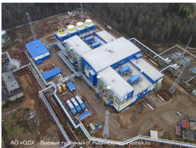
АО «ОДК – Газовые турбины» (г. Рыбинск) vps-rybinsk.ru

Предлагается к продаже на торгах единым лотом имущественный комплекс парогазовой теплоэлектростанции ПГУ-ТЭС 52 МВт на территории районной котельной г. Тутаева, включающий имущество и имущественные права АО «Тутаевская ПГУ» (котельное оборудование, газовые и тепловые сети, обслуживающие транспортные средства, товарно-материальные ценности, права аренды на земельные участки, на недвижимое и движимое имущество), часть которого находится в залоге у конкурсного кредитора ВЭБ.РФ.