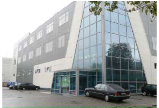
Внешний вид здания