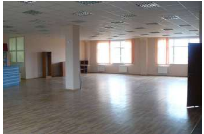
Состояние внутренней отделки