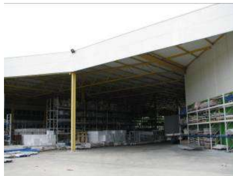
Здание лит. Б