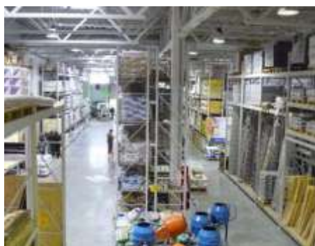
Типичное состояние отделки лит. А