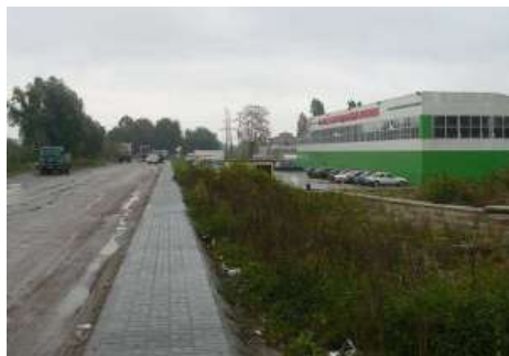
Ул. Промышленная - подъездные пути к Объекту