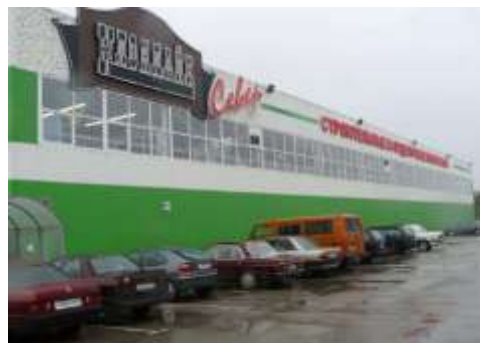
Здание лит. А