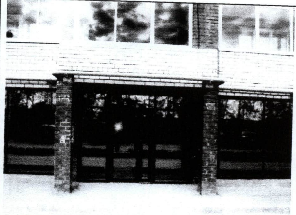
Фото №06 Объект оценки (лит А) (вход)