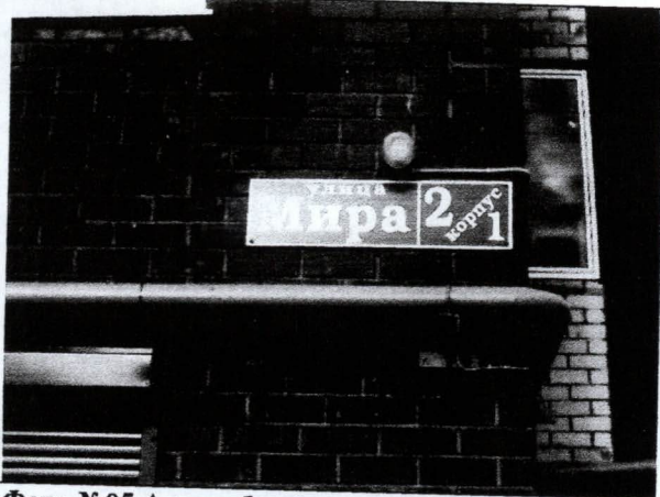
Фото №05 Адрес объекта оценки (лит А)