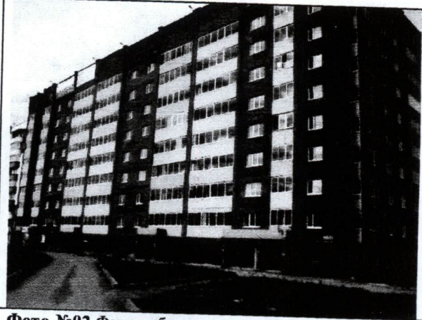
Фото №02 Фасад объекта оценки (лит А) (Вид спереди-слева)