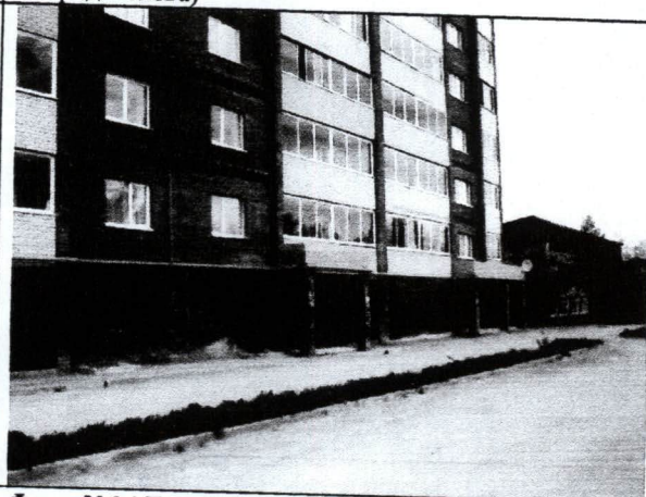
Фото №04 Главный фасад объекта оценки (лит А) (Вид справа)