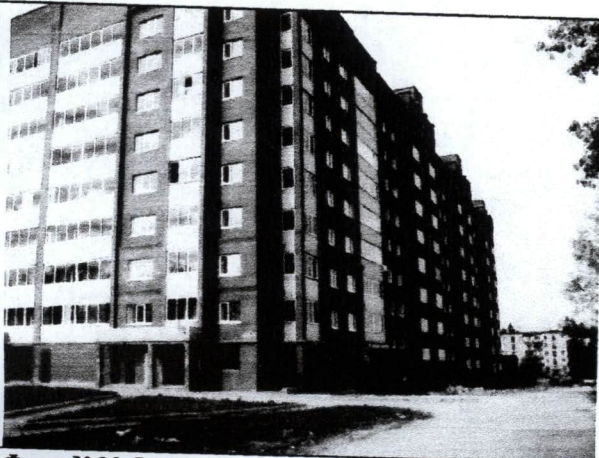
Фото №03 Фасад объекта оценки (лит А) (Вид слева)