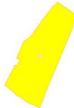
План земельного участка 50:23:0050214:140