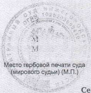
Место гербовой печати суда (мирового судьи) (М.П.)

общество с ограниченной ответственностью «Сетьстройпроект» 117335, г. Москва, ул. Архитектора Власова, д. 6 119027, г. Москва, Киевское шоссе, БП Румянцево, коп. Д, 19 подъезд, 3 этаж ОГРН 5087746115430, ИНН 7722657831, дата регистрации 16.09.2008