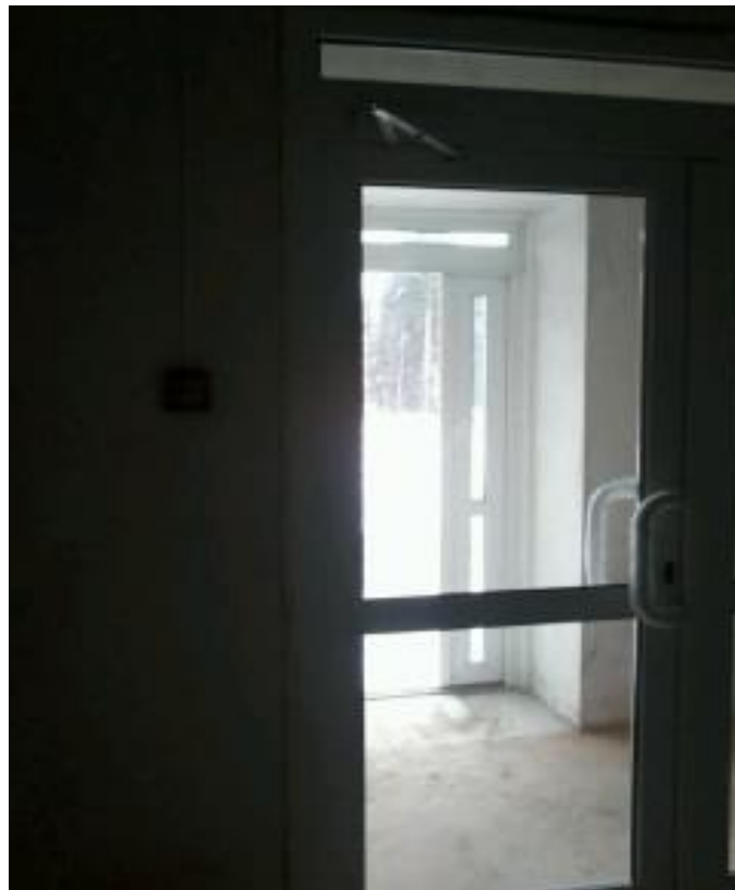
Фото. 3. Входная группа