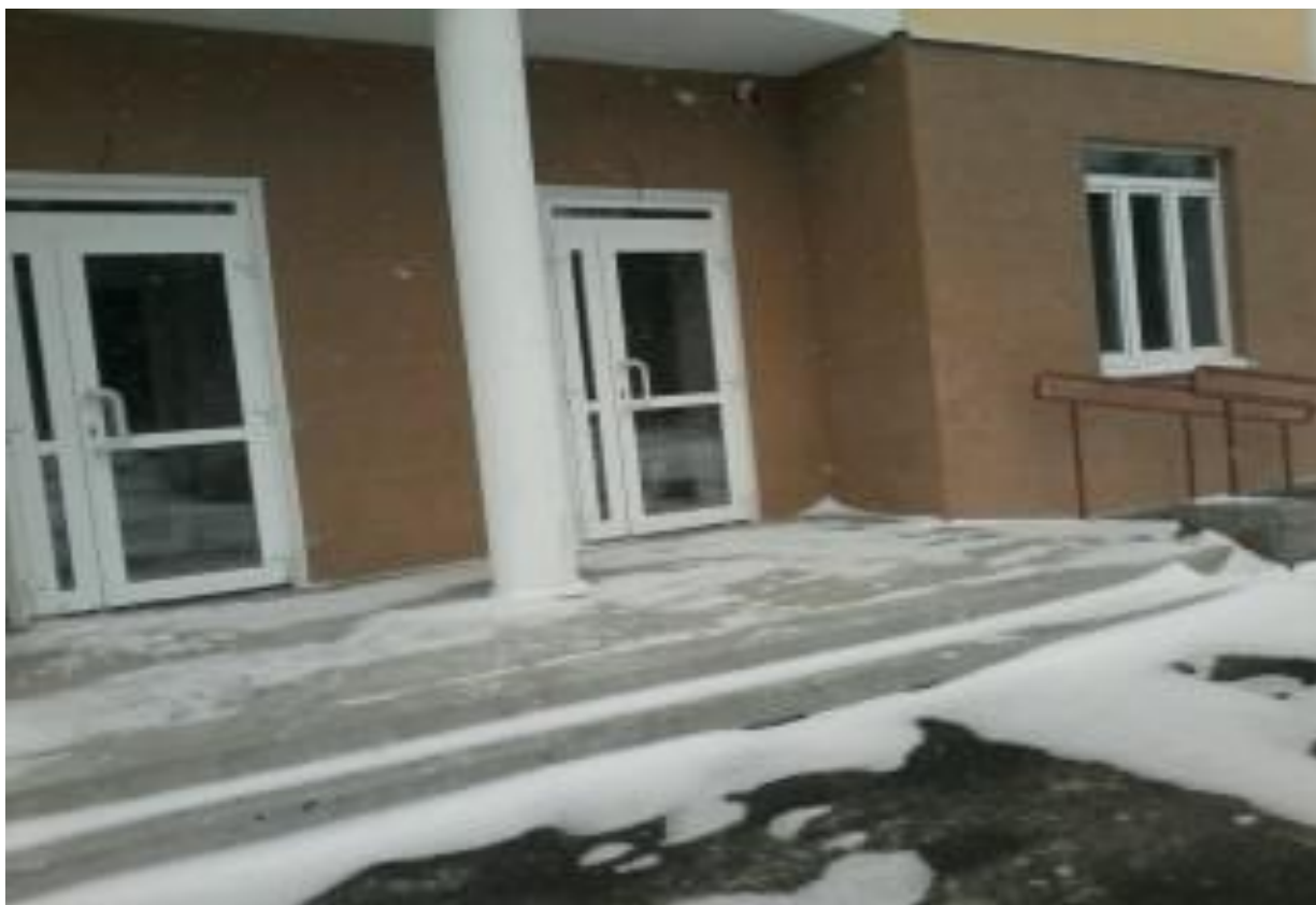
Фото. 2. Вход в оцениваемое помещение