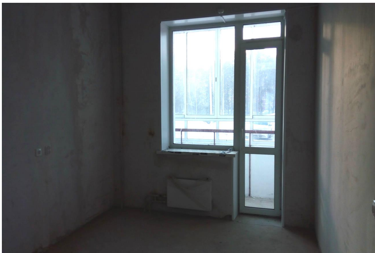
Фото. 4. Помещения