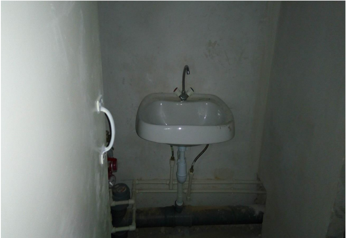
Фото. 6. Помещения