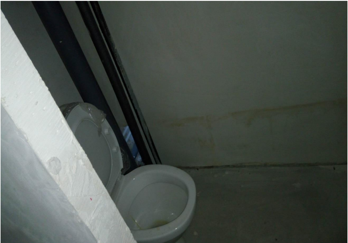
Фото. 7. Помещения