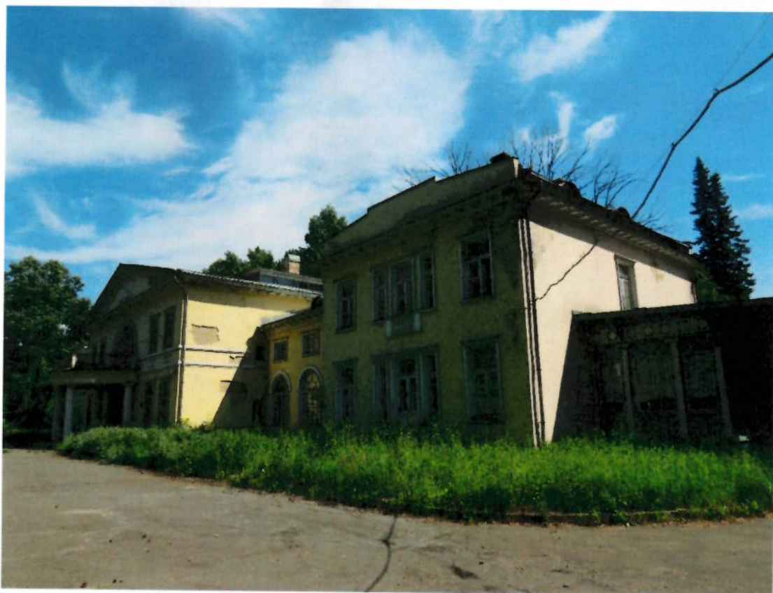
Фото № 1. Западный фасад.