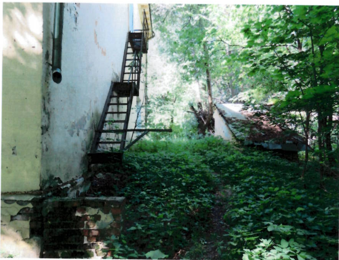
Фото № 3. Фрагмент северного фасада. Цоколь. Осыпание штукатурного слоя.