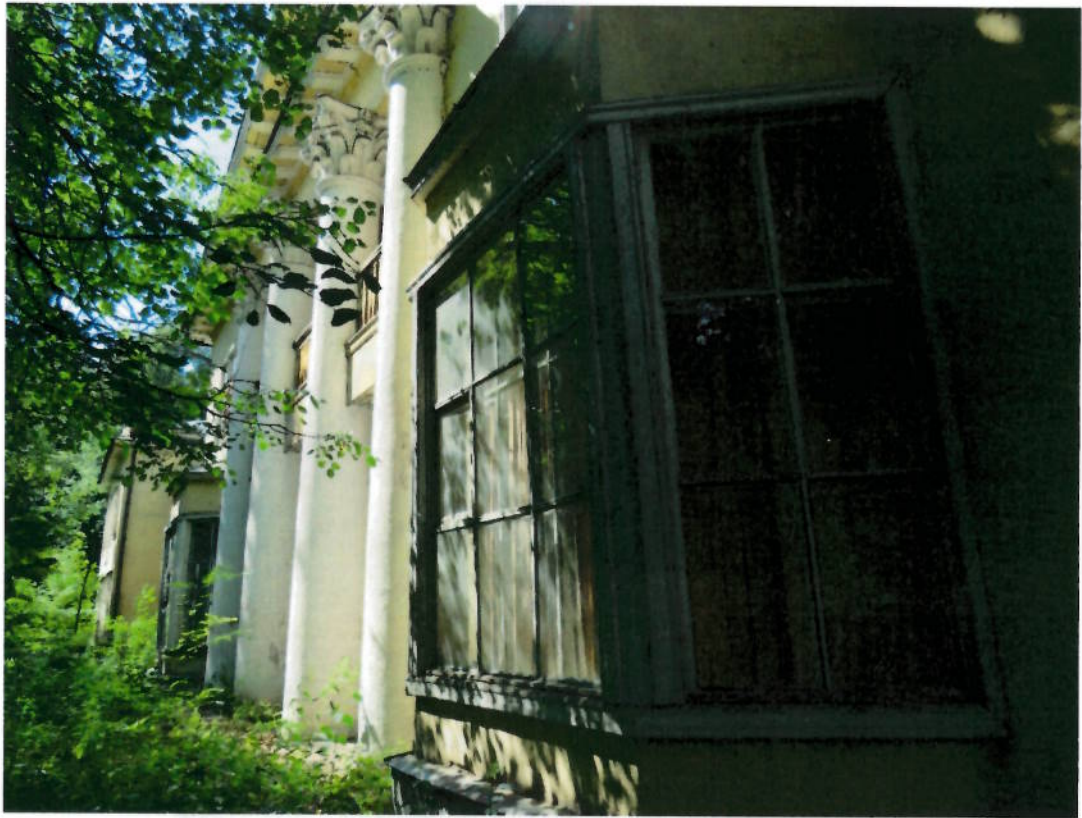
Фото № 7. Фрагмент восточного фасада. Эркер.