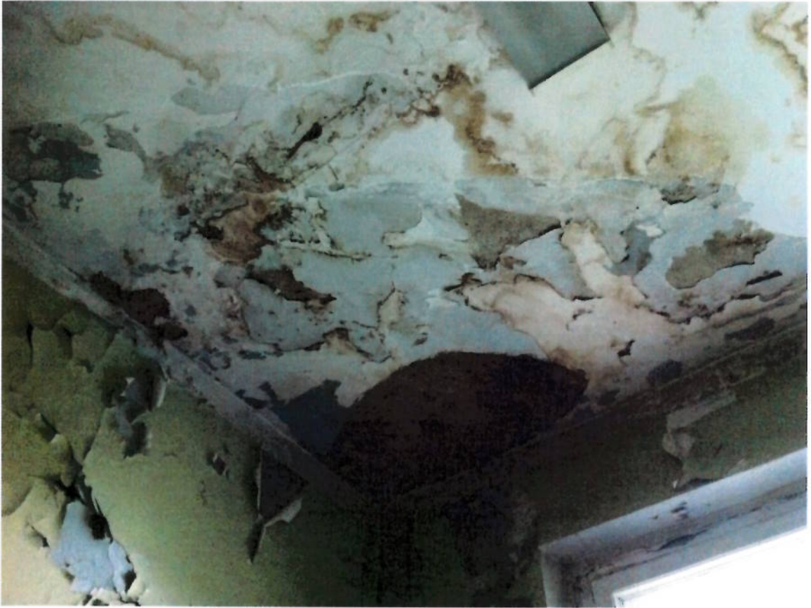
Фото № 11. Потолки второго этажа.