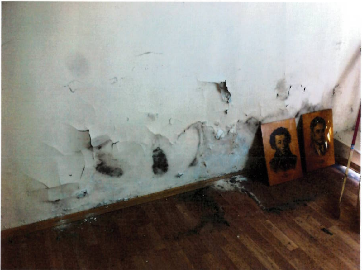
Фото № 12. Фрагмент интерьера второго этажа.