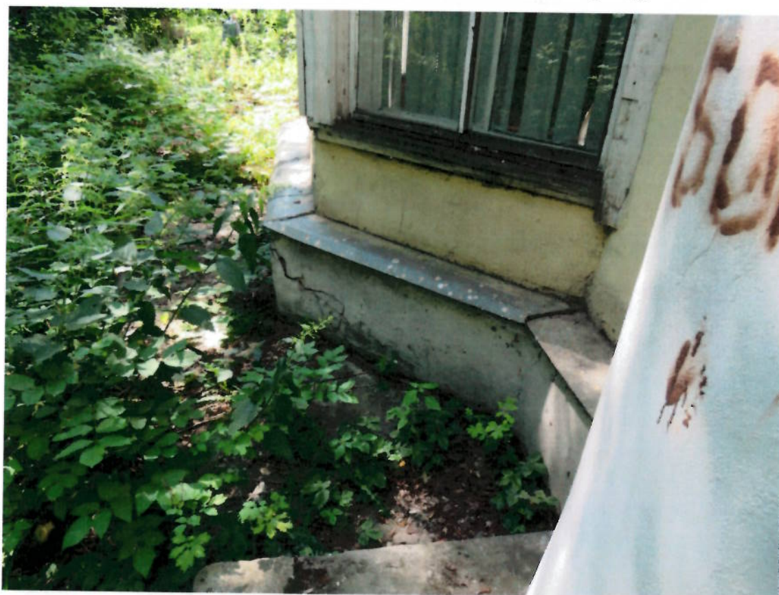
Фото № 4. Фрагмент северного фасада. Цоколь. Трещины.