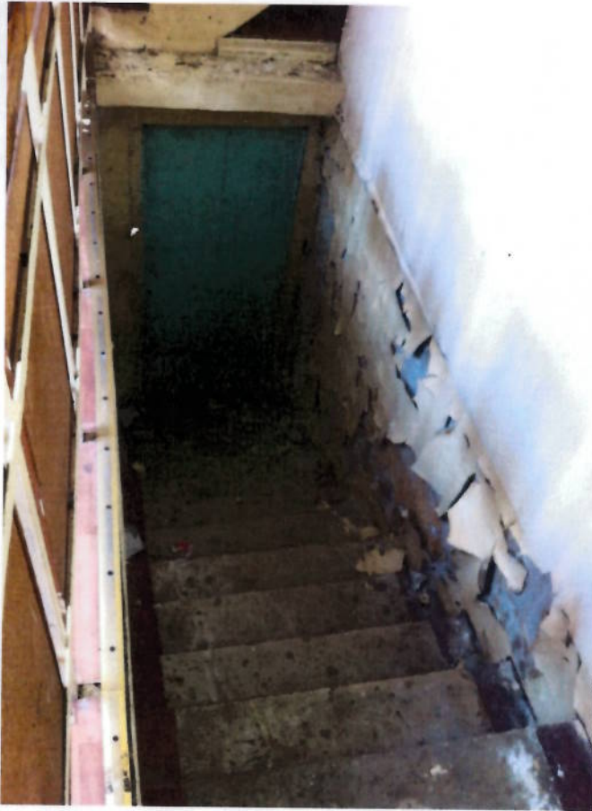
Фото № 13. Лестница в подвал.