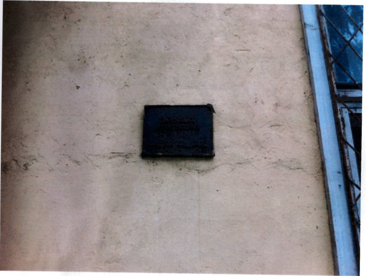
Фото № 17. Информационная надпись.