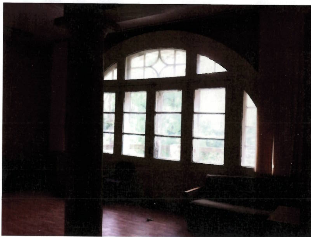
Фото № 16. Зал второго этажа с дорическими колоннами.