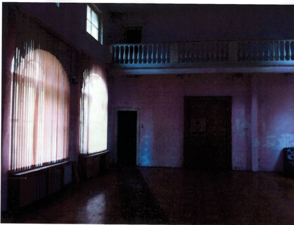
Фото № 15. Двусветный зал.