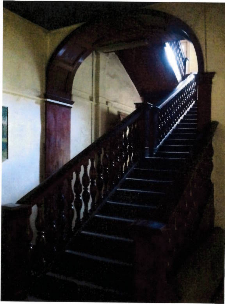
Фото № 9. Лестница в вестибюле из темного дуба.