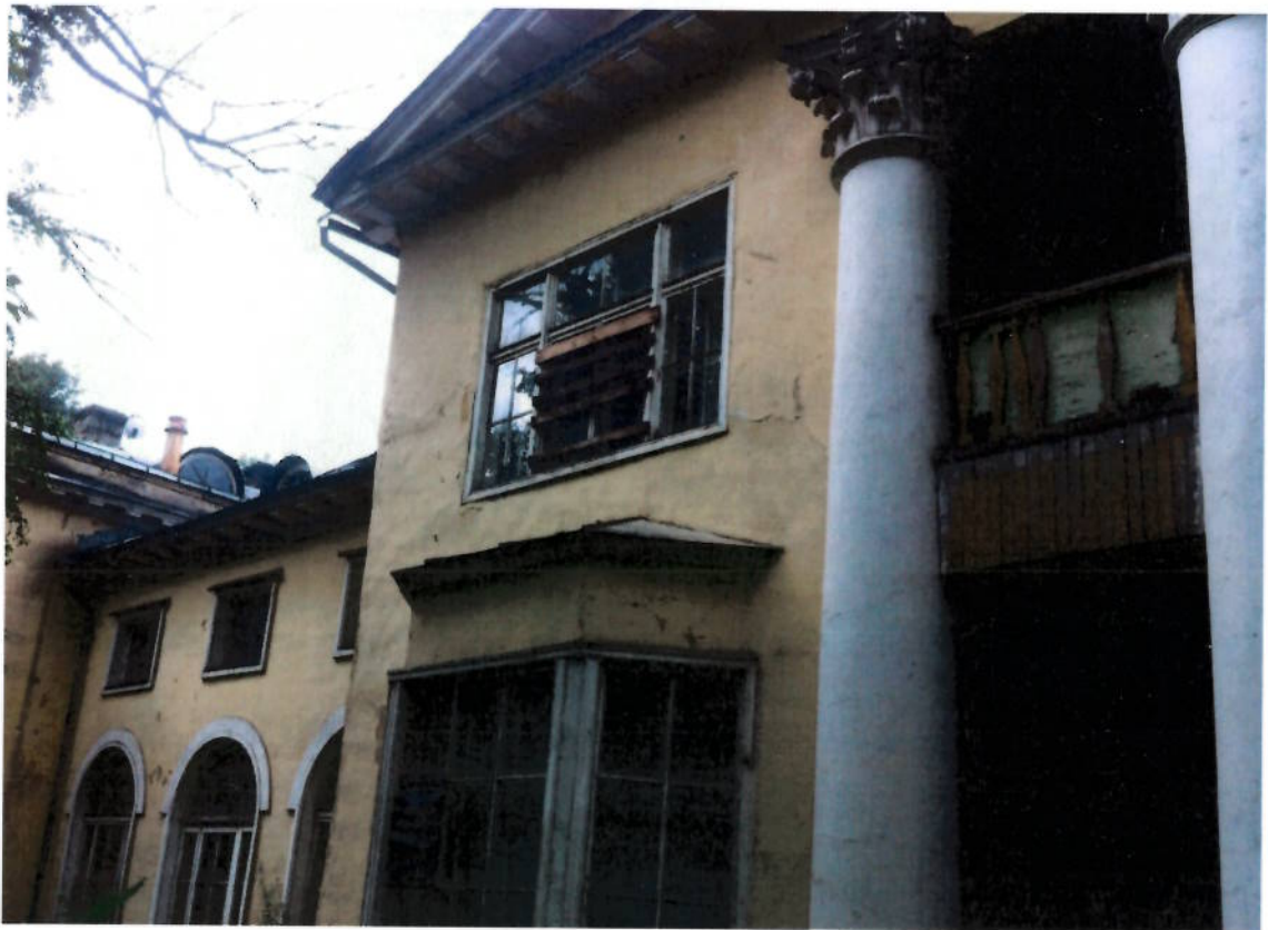
Фото № 6. Фрагмент восточного фасада. Отсутствие оконных заполнений.