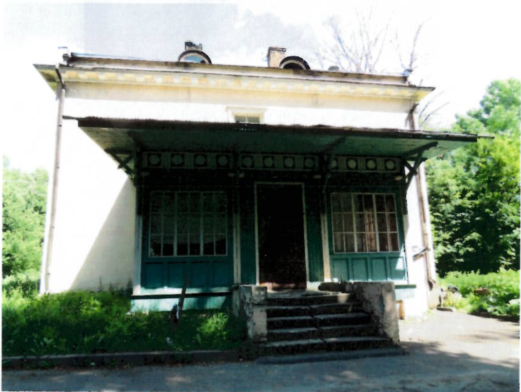
Фото № 8. Пристройка советского периода у южного фасада.