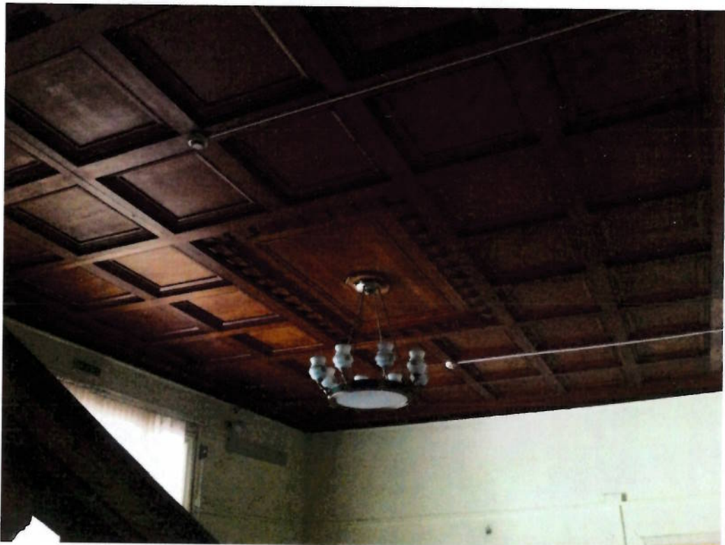
Фото № 10. Кессонированные дубовые потолки в вестибюле. Люстра середины XX в.