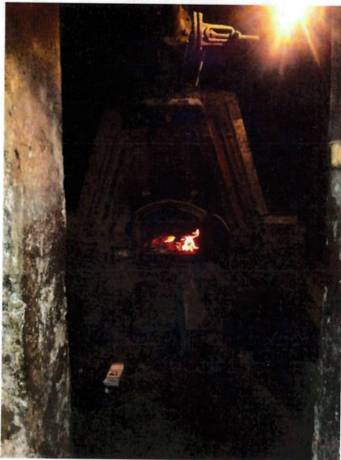
Фото № 14. Печная угольная отопительная система в подвале.