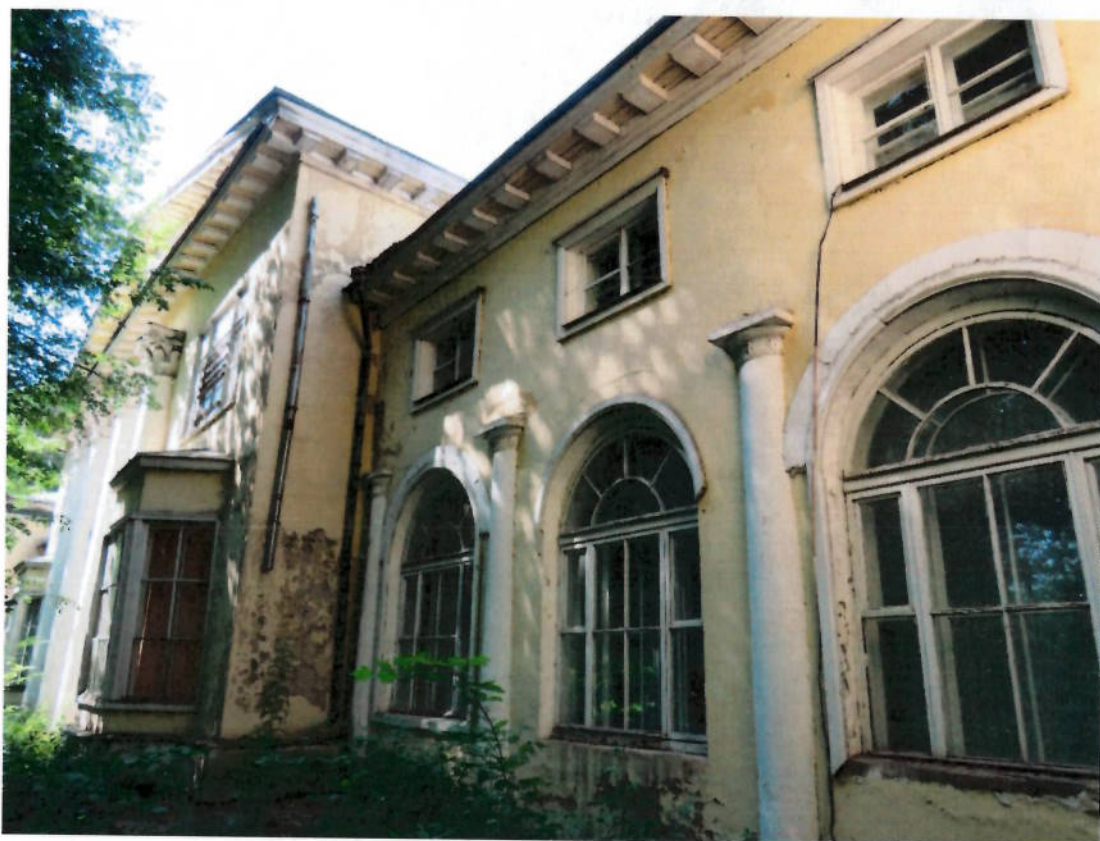
Фото № 2. Фрагмент западного фасада. Осыпание штукатурного слоя.