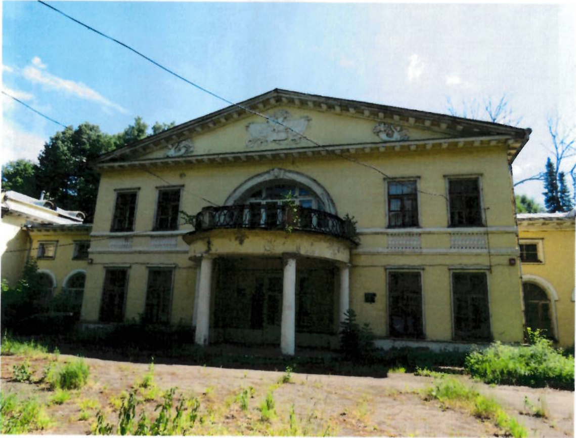
Фото № 5. Фрагмент западного фасада.