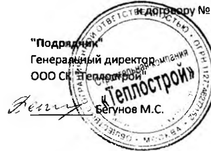
ГРАФИК ПЛАТЕЖЕЙ по строительству блочной газодизельной котельной и дымовых труб многофункционального гостинично-оздоровительного комплекса "Адмирал"