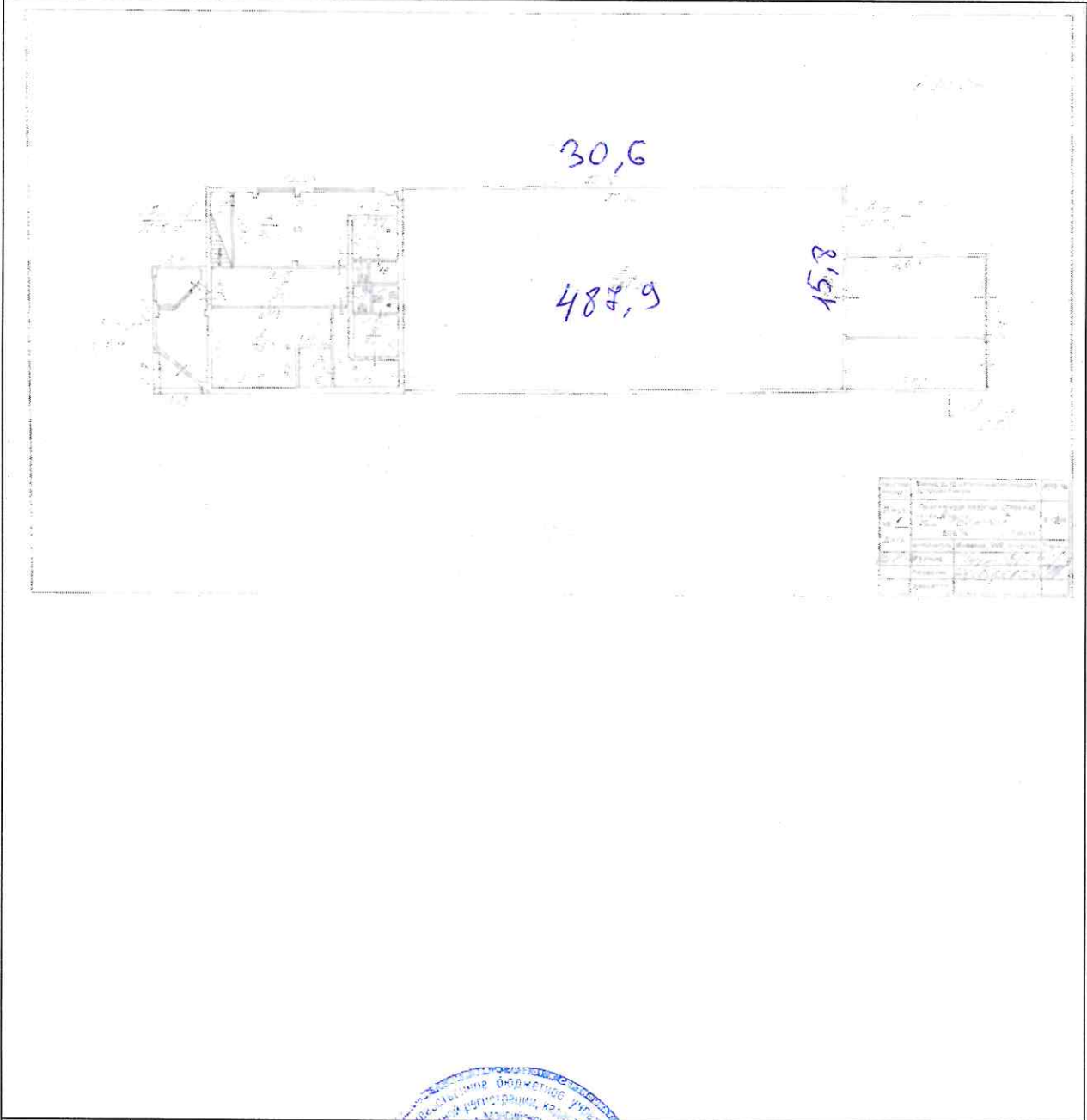
Схема расположения объекта недвижимого имущества на земельном участке(ах):

"03" октября 2013 г. № 86/201/13-168318 Кадастровый номер: 86:10:0000000:219