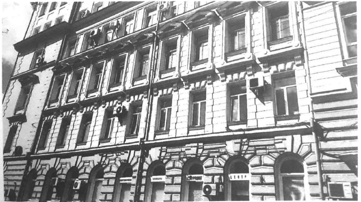
Фото № 5. Вид на фасад с 3-го Колобовского переулка.