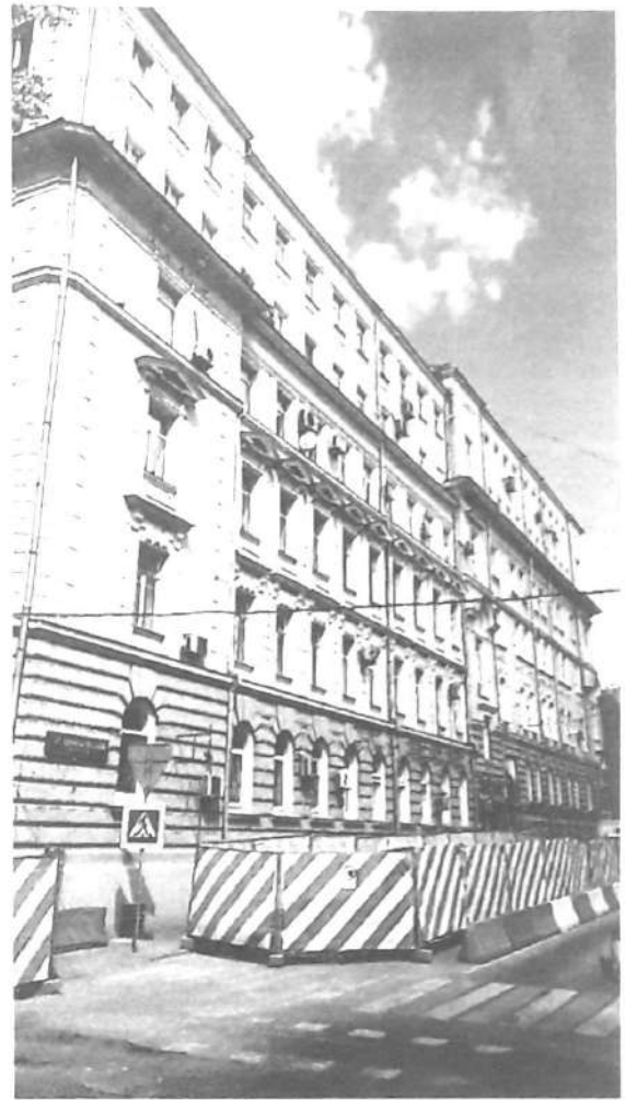
Фото № 4. Вид с 3-го Колобовского переулка.