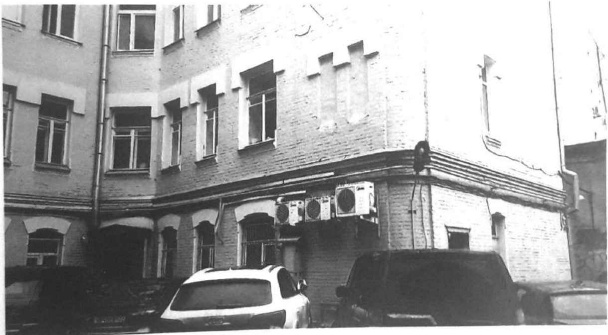
Фото № 7. Вид на дворовый фасад.