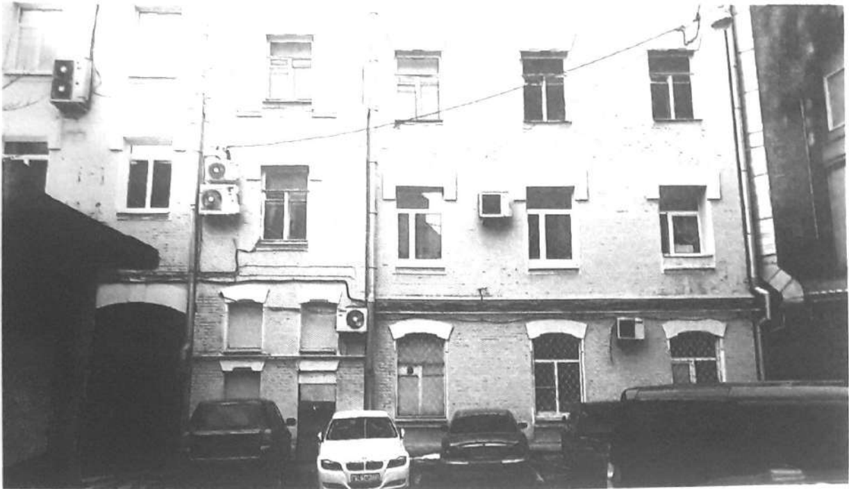
Фото № 6. Вид на дворовый фасад.