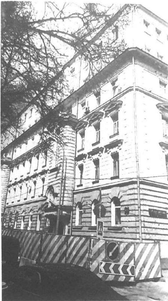
Фото № 3. Вид с Петровского бульвара.