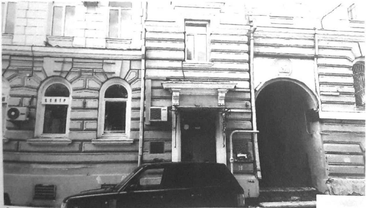
Фото № 2. Вид на фасад и въездную арку с 3-го Колобовского переулка.