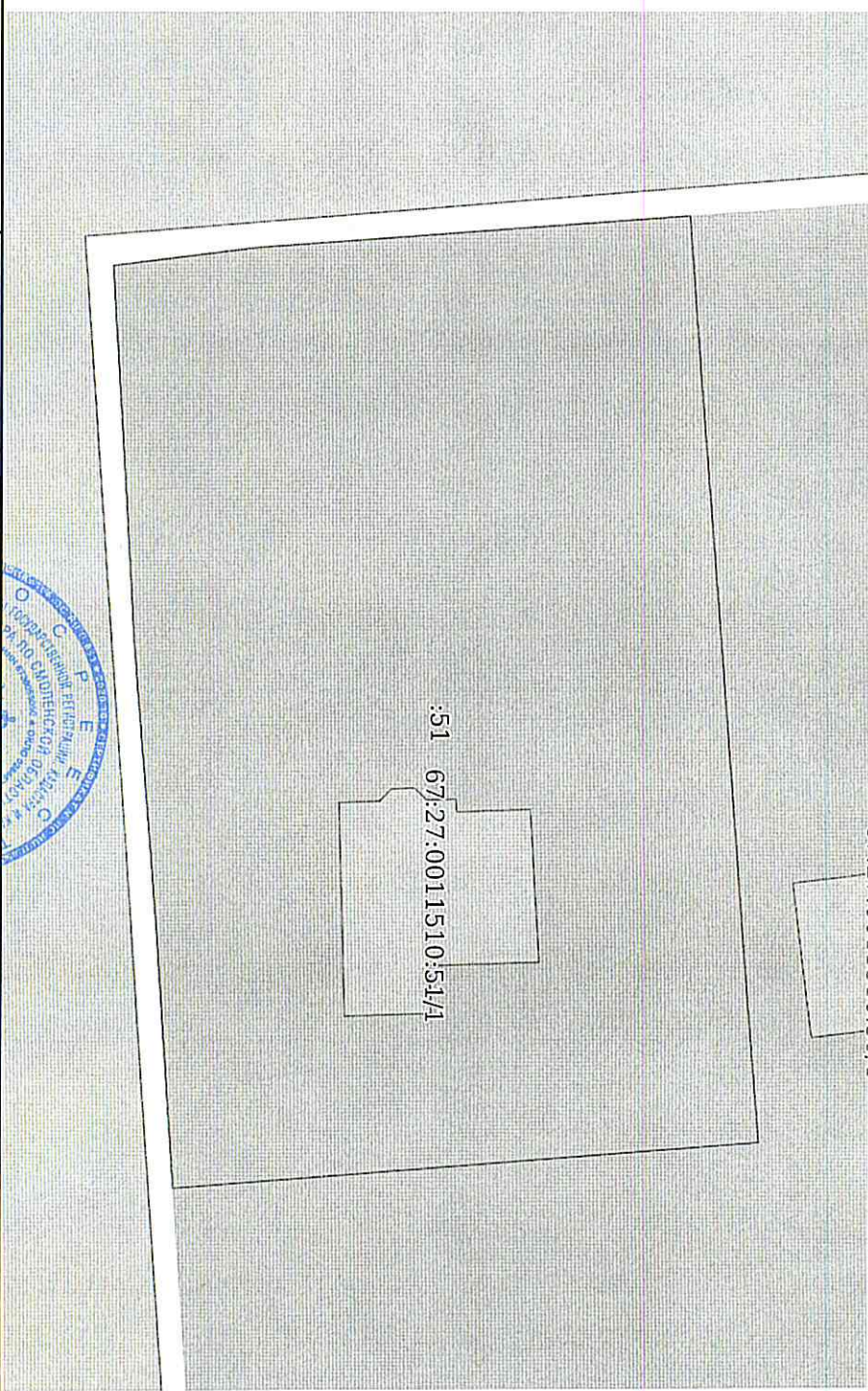
Схема расположения объекта недвижимости (части объекта недвижимости) на земельном участке(ах)