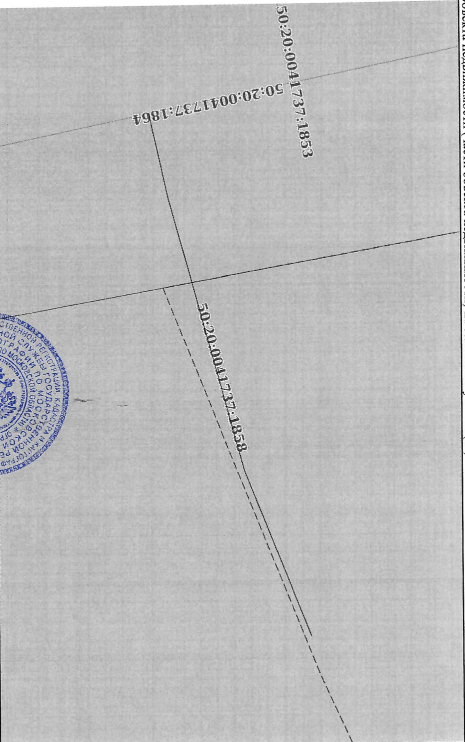
Схема расположения объекта недвижимости (части объекта недвижимости) на земельном участке(ах)