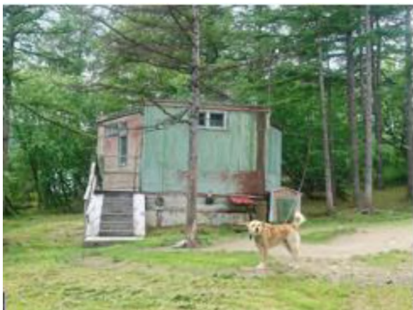
Домик гаражный (Здание бытового назначения)