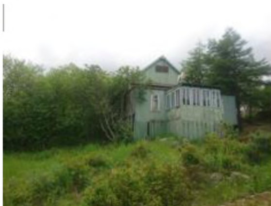
Домик шестигранный (Домик для отдыха)