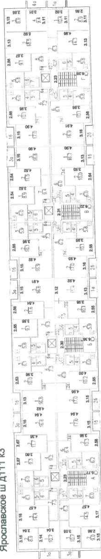
306321 8 этаж Ярославское ш д111 к3