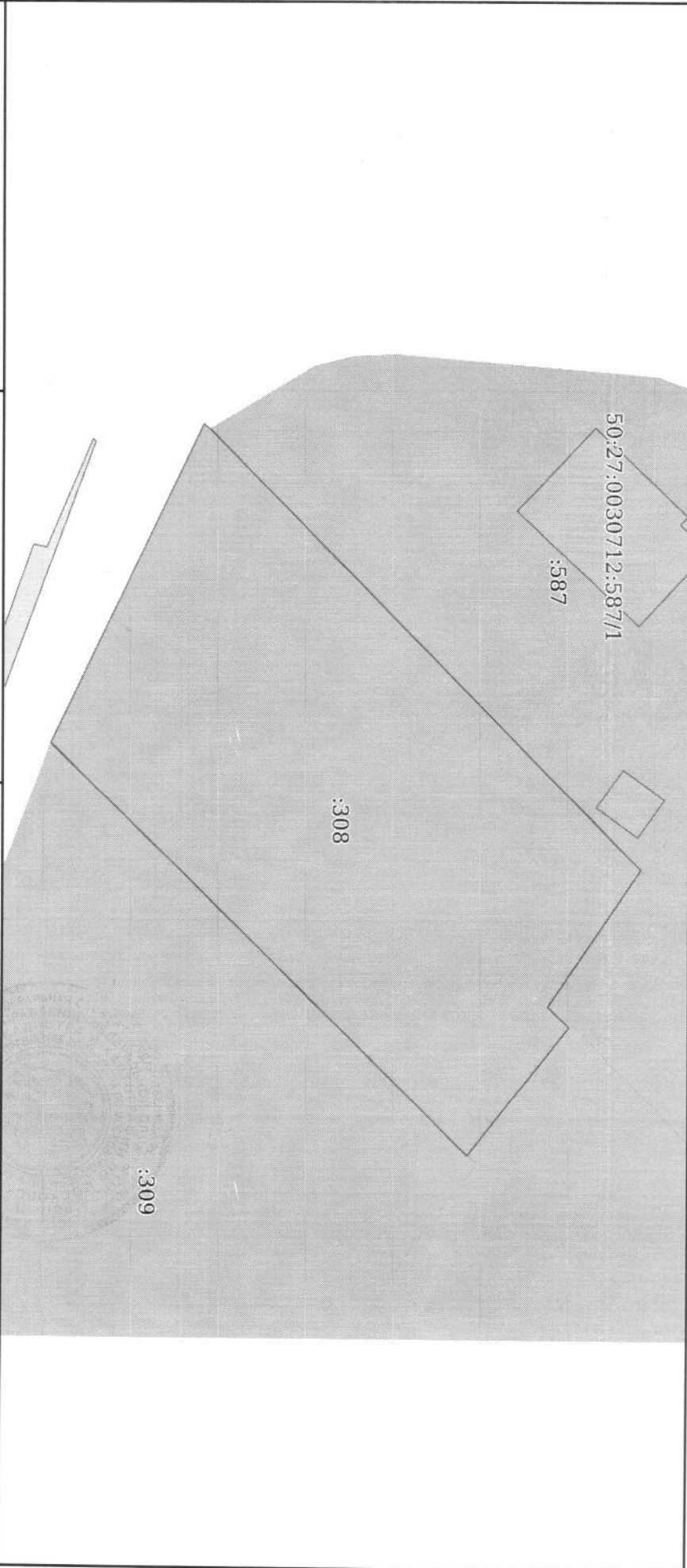
Схема расположения объекта недвижимости (части объекта недвижимости) на земельном участке(ах)