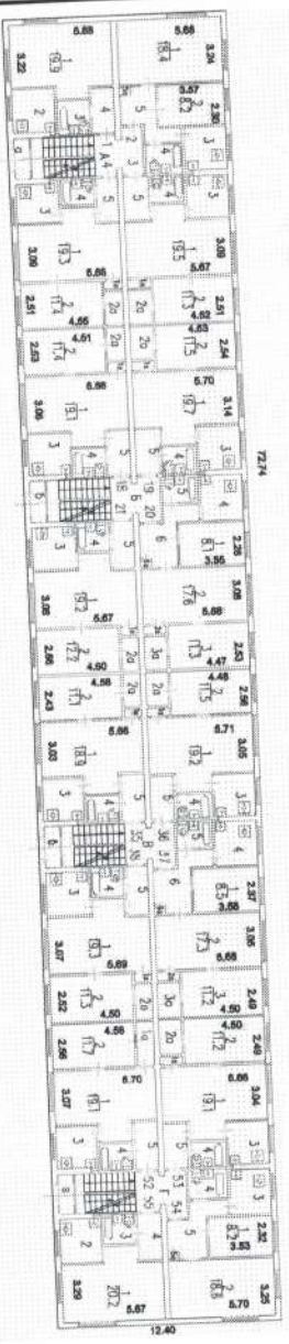
1 Этаж ( ул. Профсоюзная, д.58/32, кор.2 )