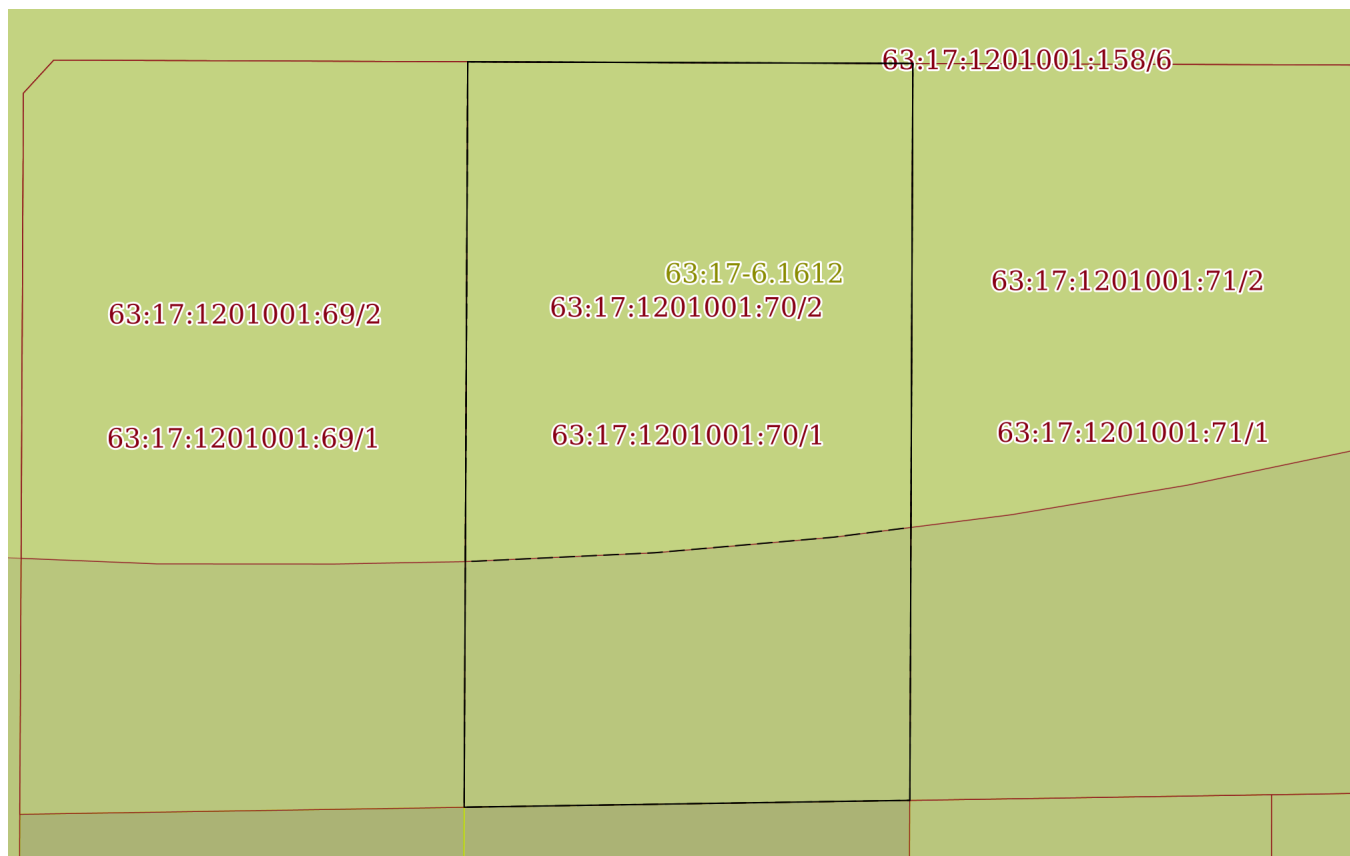
План (чертеж, схема) земельного участка