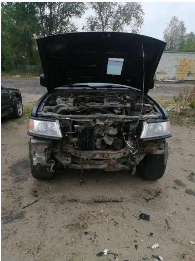
Фото №3. Общий вид