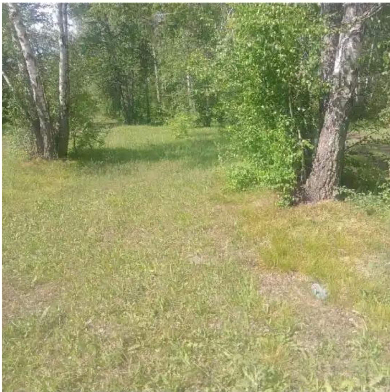
Фото №1. Общий вид участка