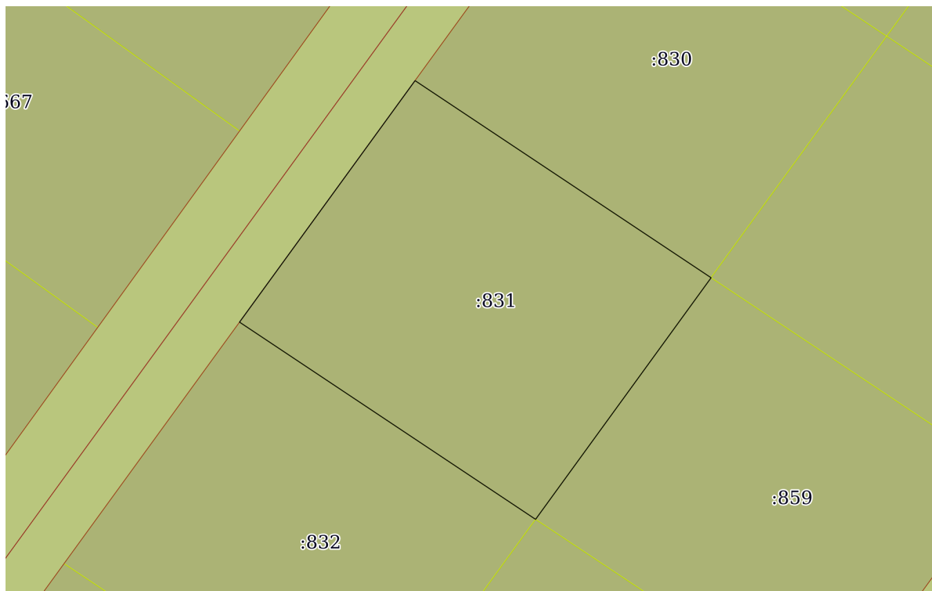
План (чертеж, схема) земельного участка