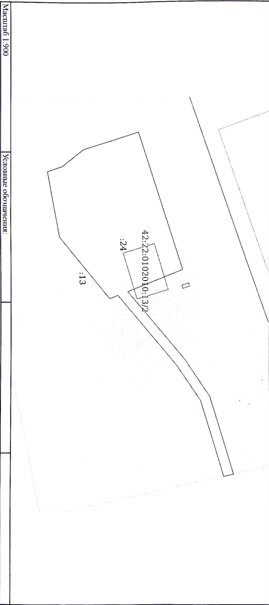
Схема расположения объекта недвижимости (части объекта недвижимости) на земельном участке(ах)