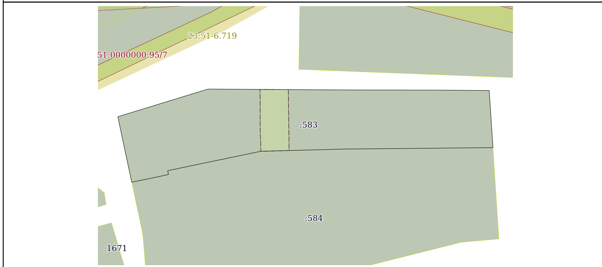
План (чертеж, схема) земельного участка