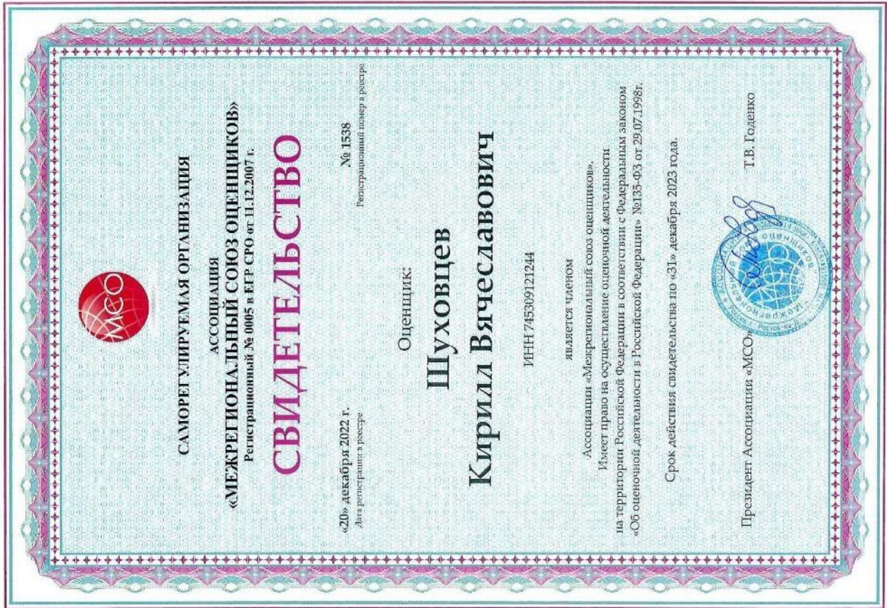
Свидетельство о членстве в СРО оценщика