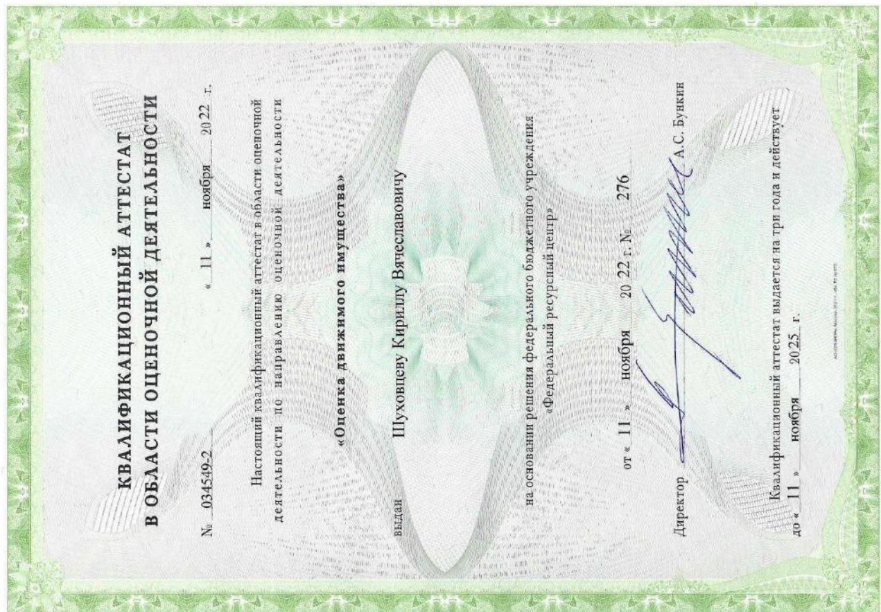
Квалификационный аттестат "Оценка движимого имущества"