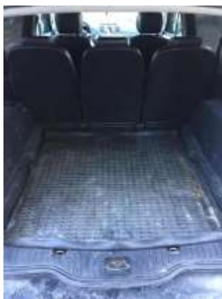
Фото №3. Общий вид