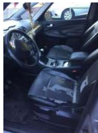
Фото №4. Общий вид