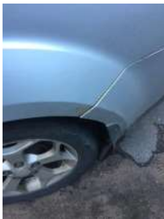
Фото №9. Дефекты эксплуатации