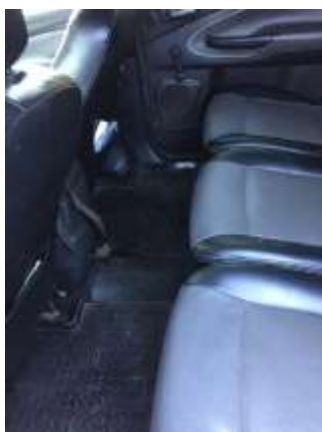
Фото №5. Общий вид