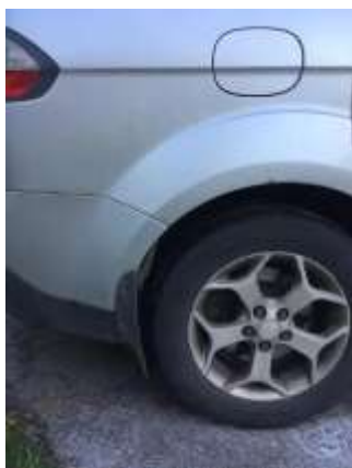
Фото №7. Дефекты эксплуатации