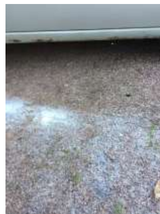
Фото №8. Дефекты эксплуатации