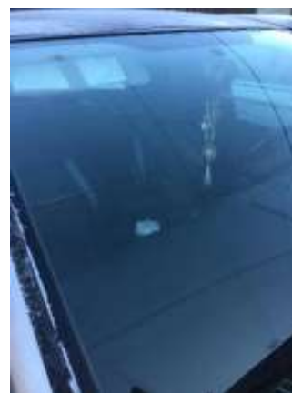
Фото №6. Дефекты эксплуатации