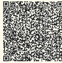
QR-код Сбербанк онлайн