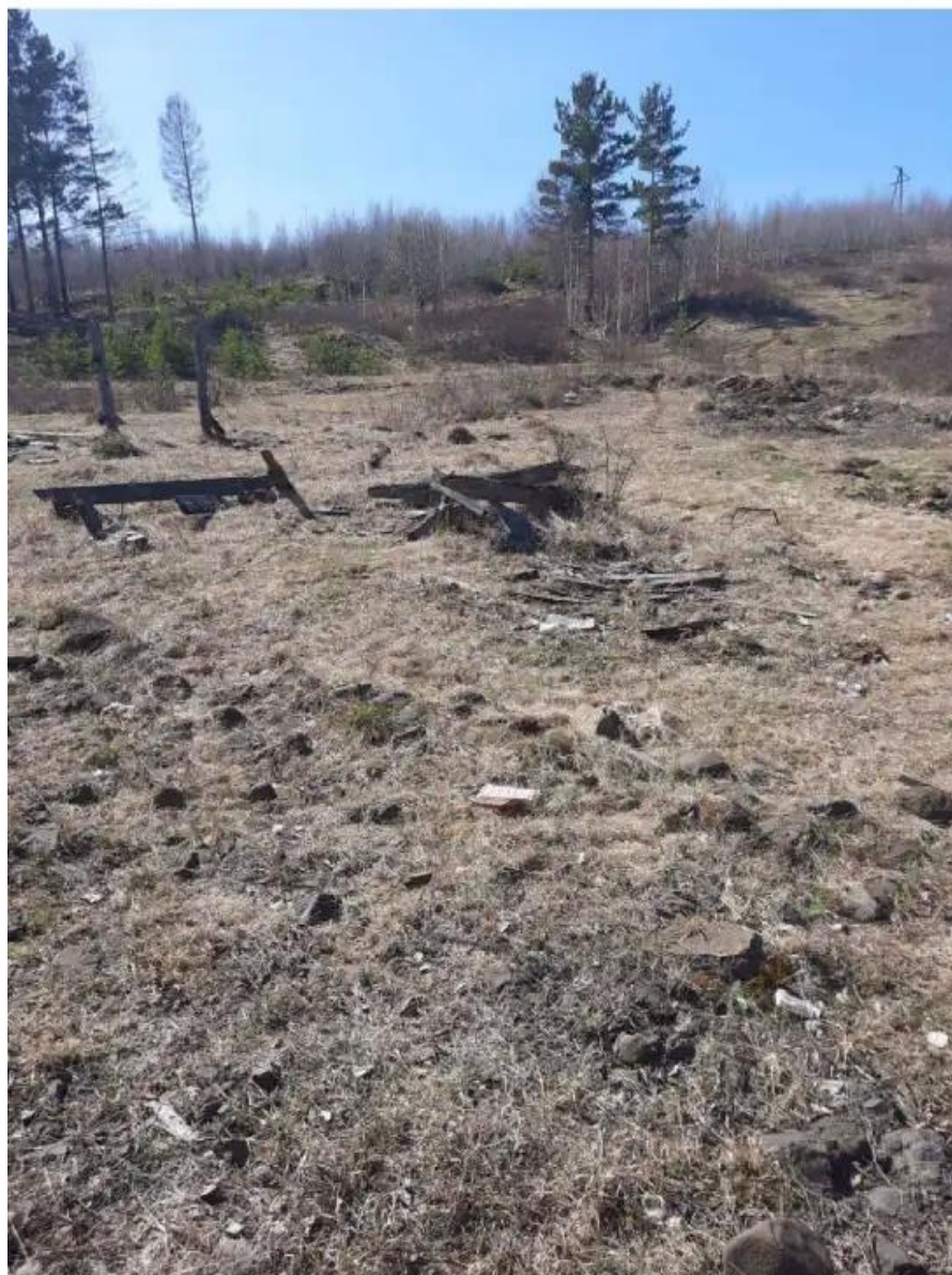
Фото №1. Общий вид участка