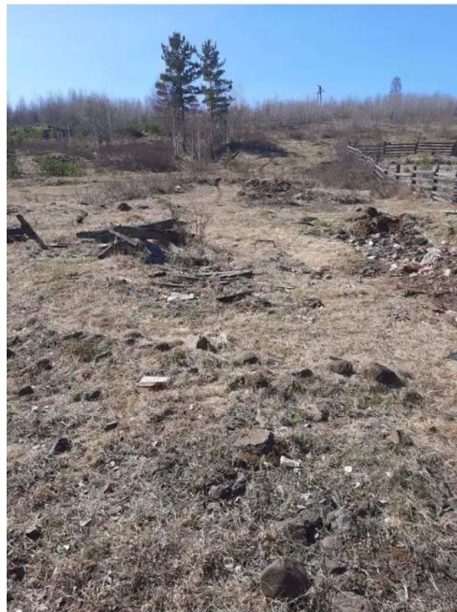
Фото №2. Общий вид участка