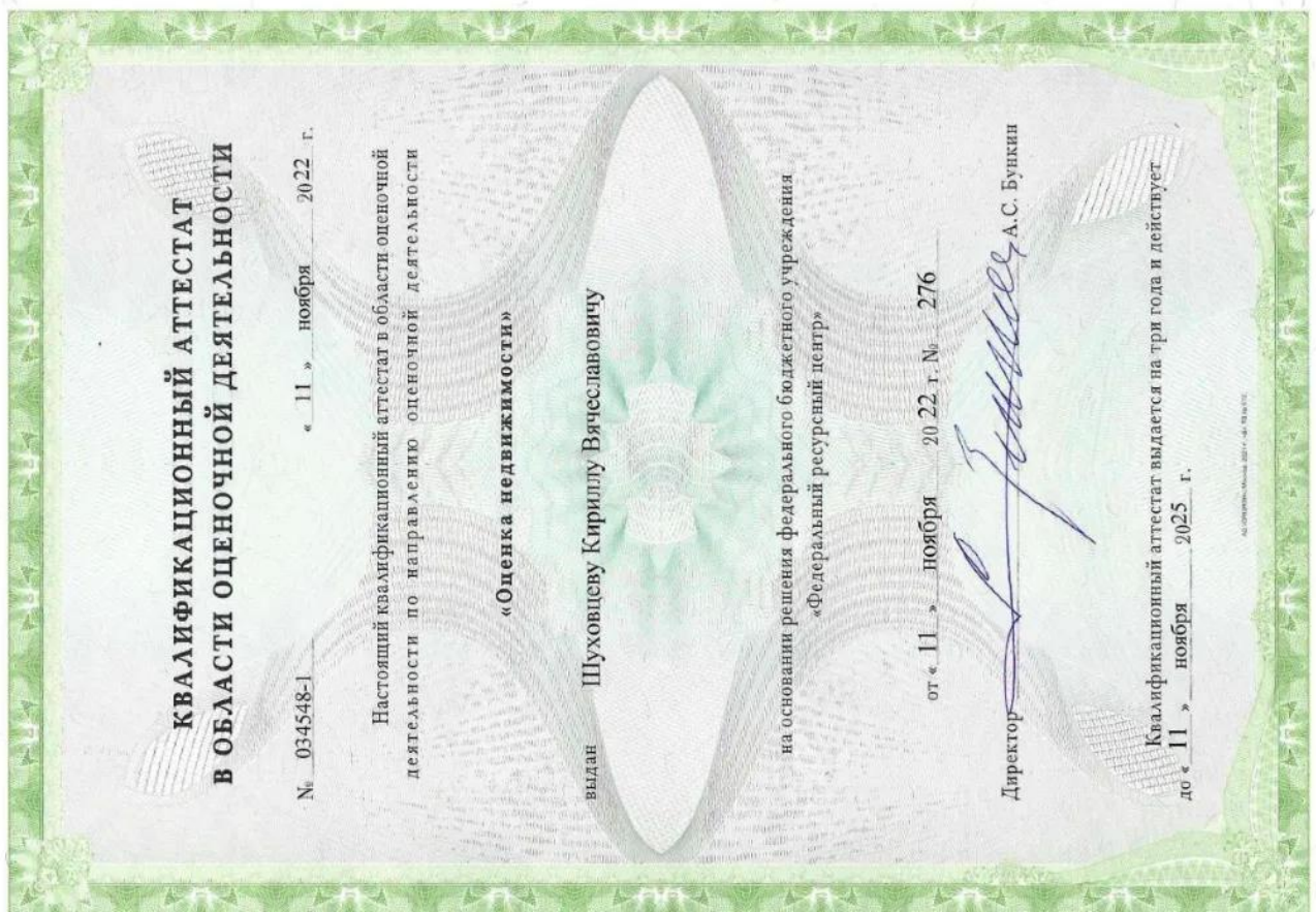
Квалификационный аттестат. Оценка недвижимости