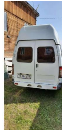
Фото №6. Общий вид