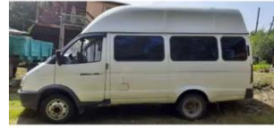
Фото №4. Общий вид