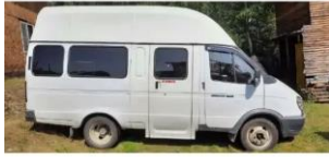
Фото №3. Общий вид