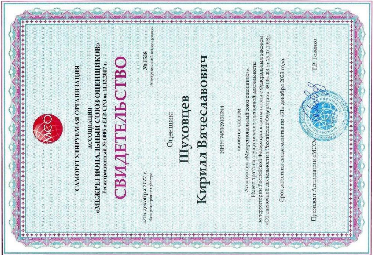
Свидетельство СРО оценщика