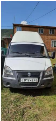
Фото №5. Общий вид