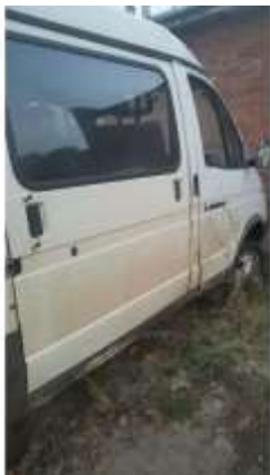
Фото №5. Общий вид