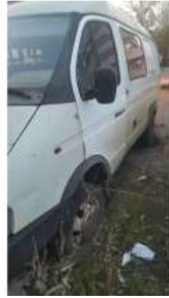
Фото №2. Общий вид