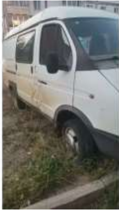
Фото №1. Общий вид