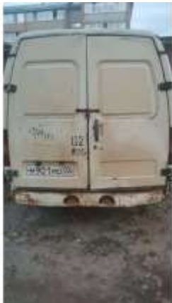
Фото №3. Общий вид