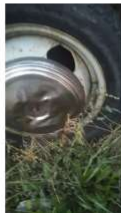
Фото №8. Дефекты эксплуатации