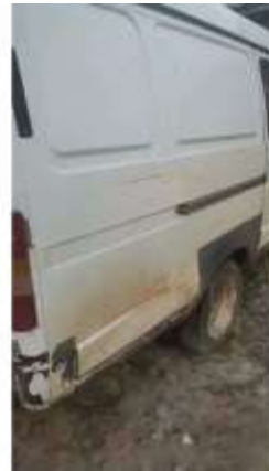
Фото №4. Общий вид