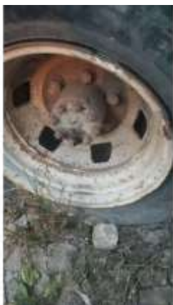
Фото №7. Дефекты эксплуатации