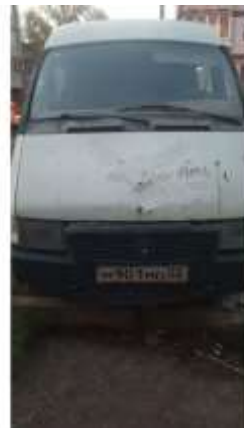
Фото №6. Общий вид