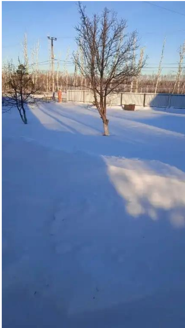
Фото №1. Шарапова ЮС фото ЗУ