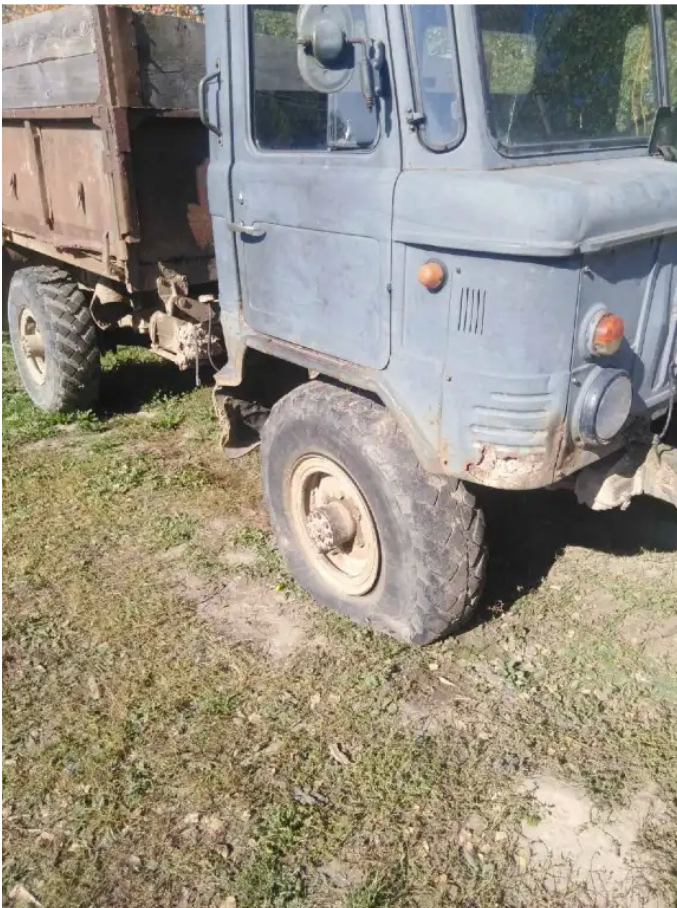
Фото №3. ГАЗ