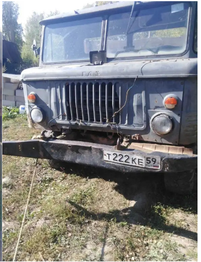
Фото №2. ГАЗ 2