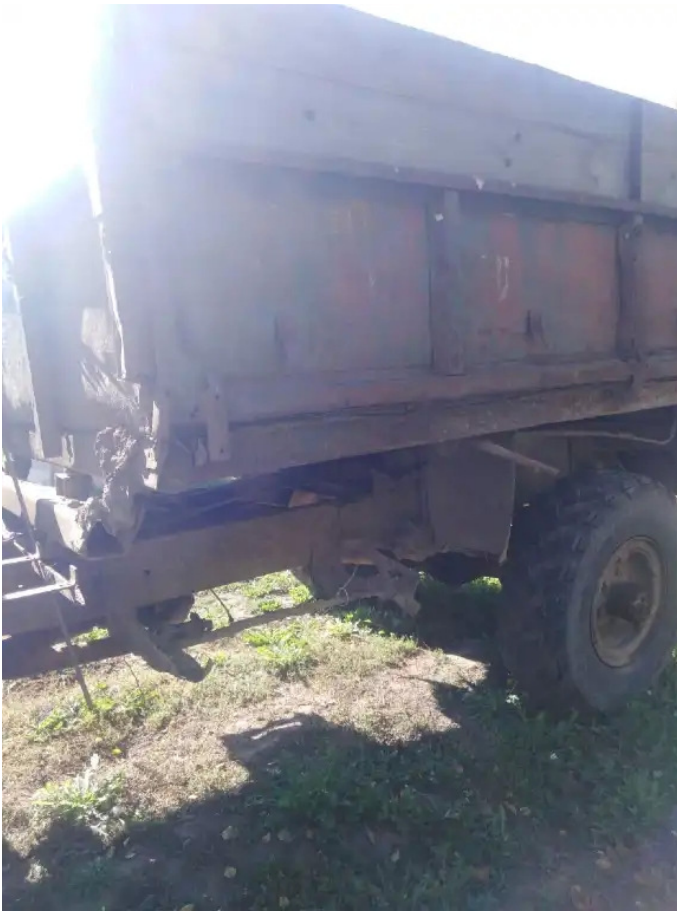
Фото №1. ГАЗ 1