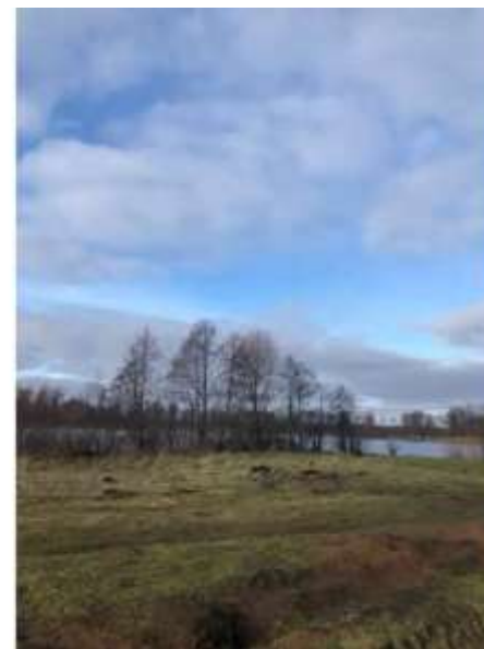
Фото №4. Общий вид участка