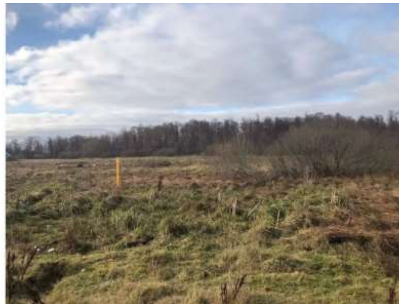
Фото №2. Общий вид участка