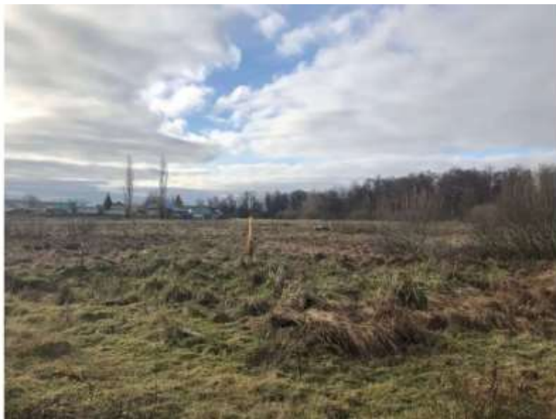
Фото №1. Общий вид участка