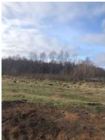
Фото №3. Общий вид участка