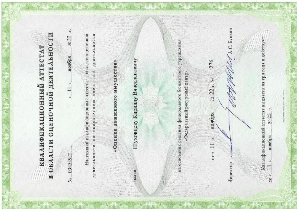
Квалификационный аттестат. Оценка движимого имущества