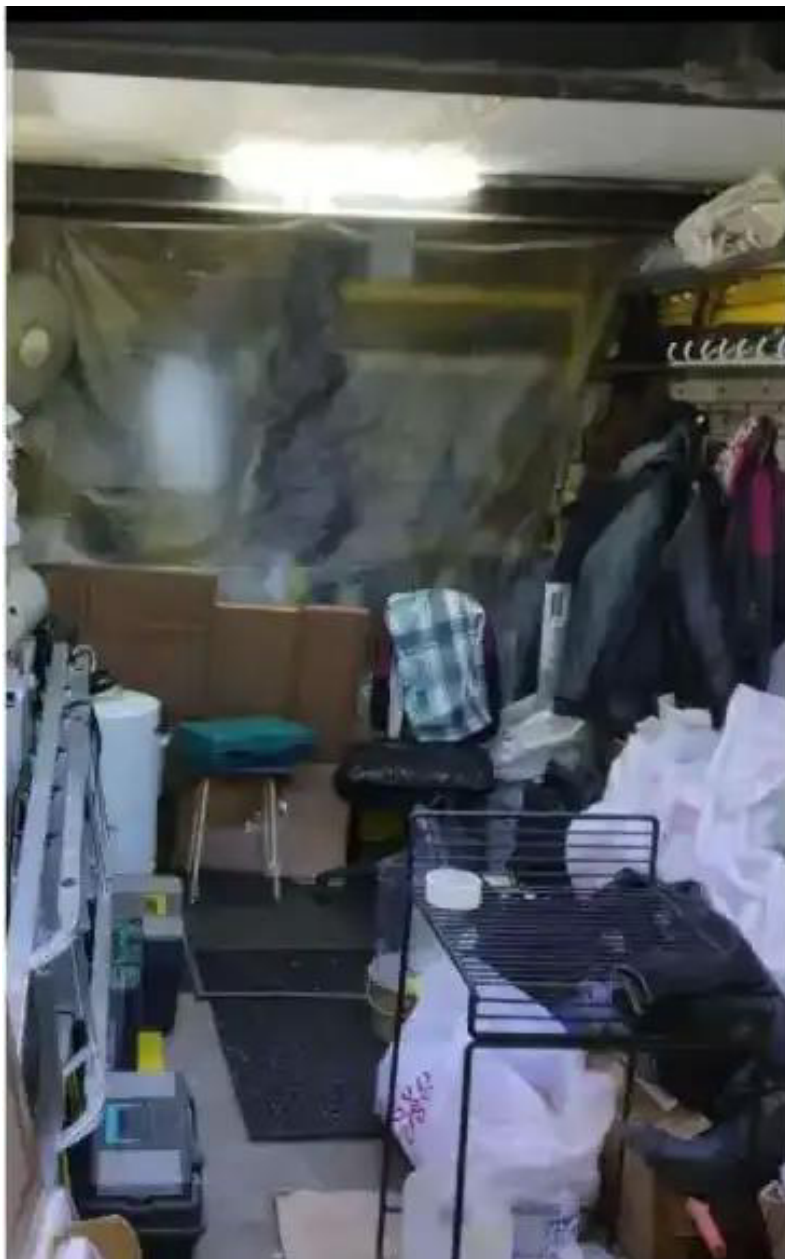
Фото №1. Общий вид гаража