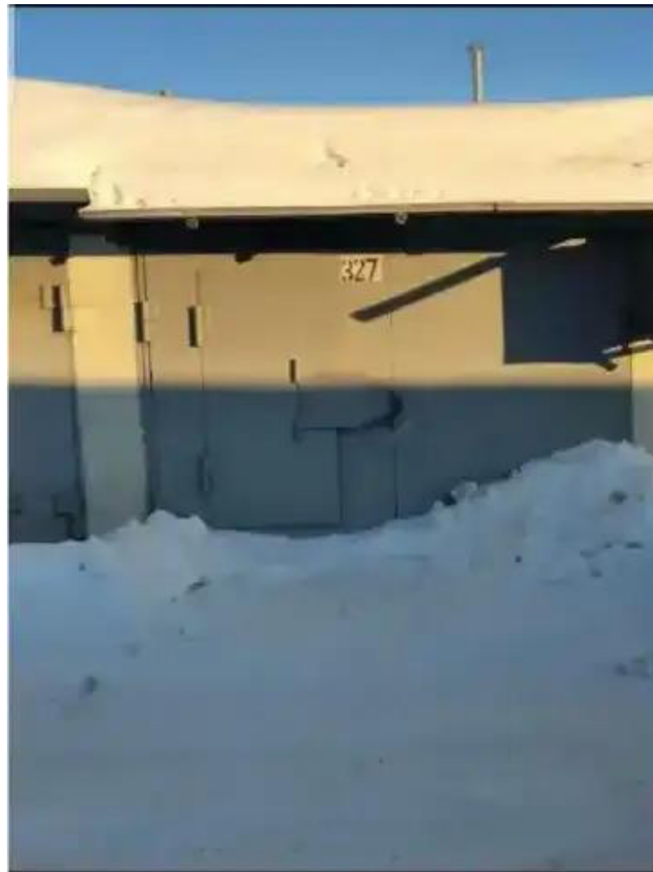
Фото №2. Общий вид гаража