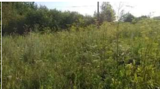
Фото №7.