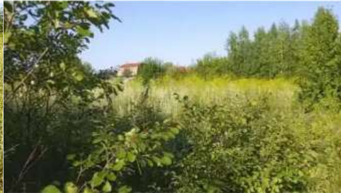
Фото №1.