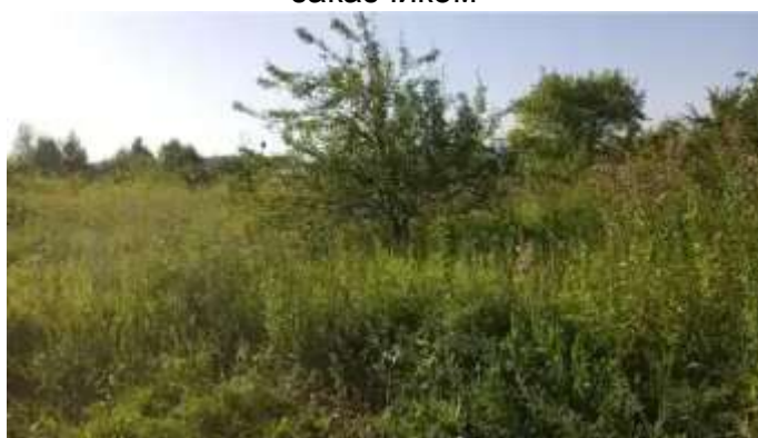
Фото №9.