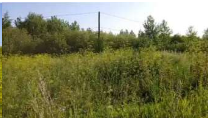
Фото №3. Фотографии, предоставленные заказчиком