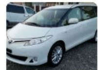
Previa 2013 48