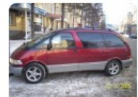
Previa 1991 66