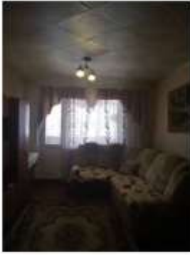
Фото №9. Общий вид