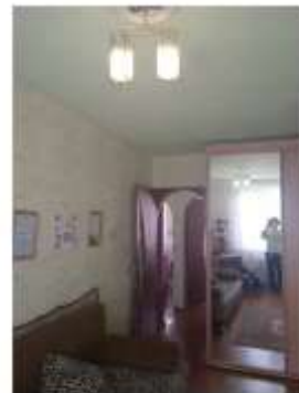
Фото №6. Общий вид