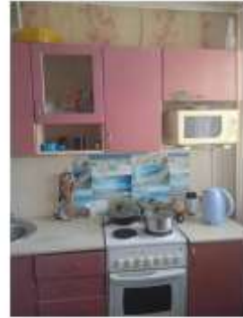
Фото №2. Общий вид