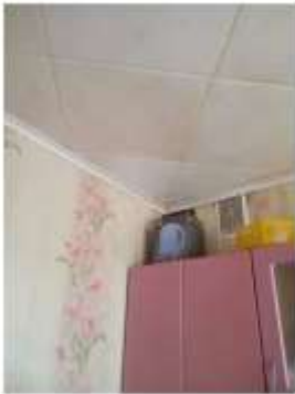
Фото №3. Общий вид