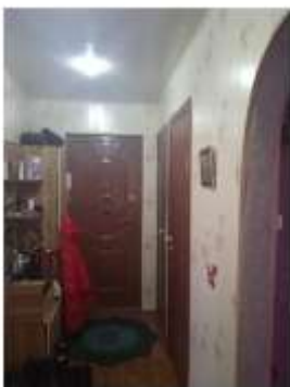
Фото №7. Общий вид