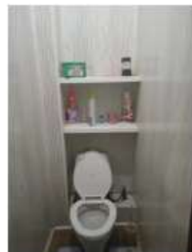
Фото №8. Общий вид