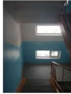
Фото №10. Общий вид