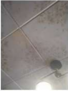
Фото №11. Общий вид