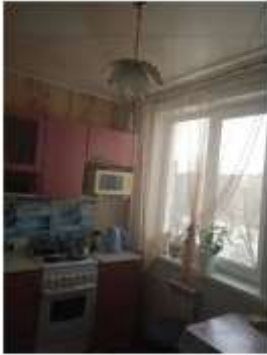
Фото №1. Общий вид