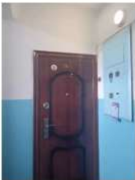
Фото №5. Общий вид