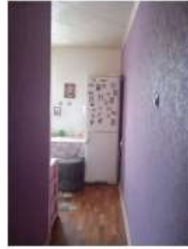
Фото №12. Общий вид