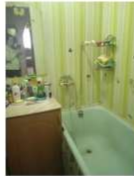
Фото №4. Общий вид