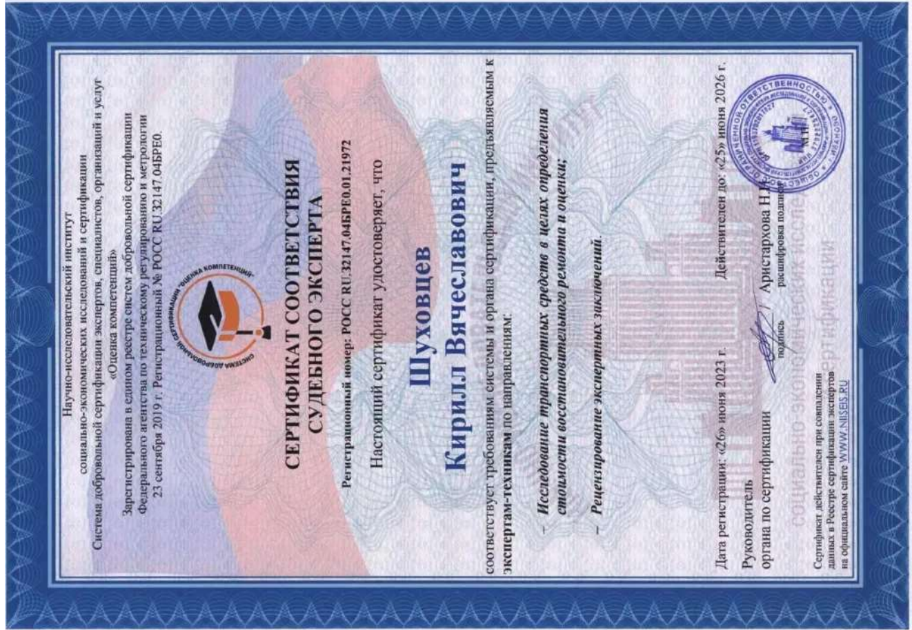
Сертификат соответствия судебного эксперта