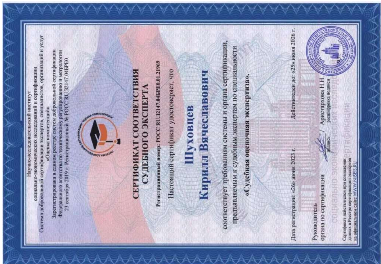
Сертификат соответствия судебного эксперта