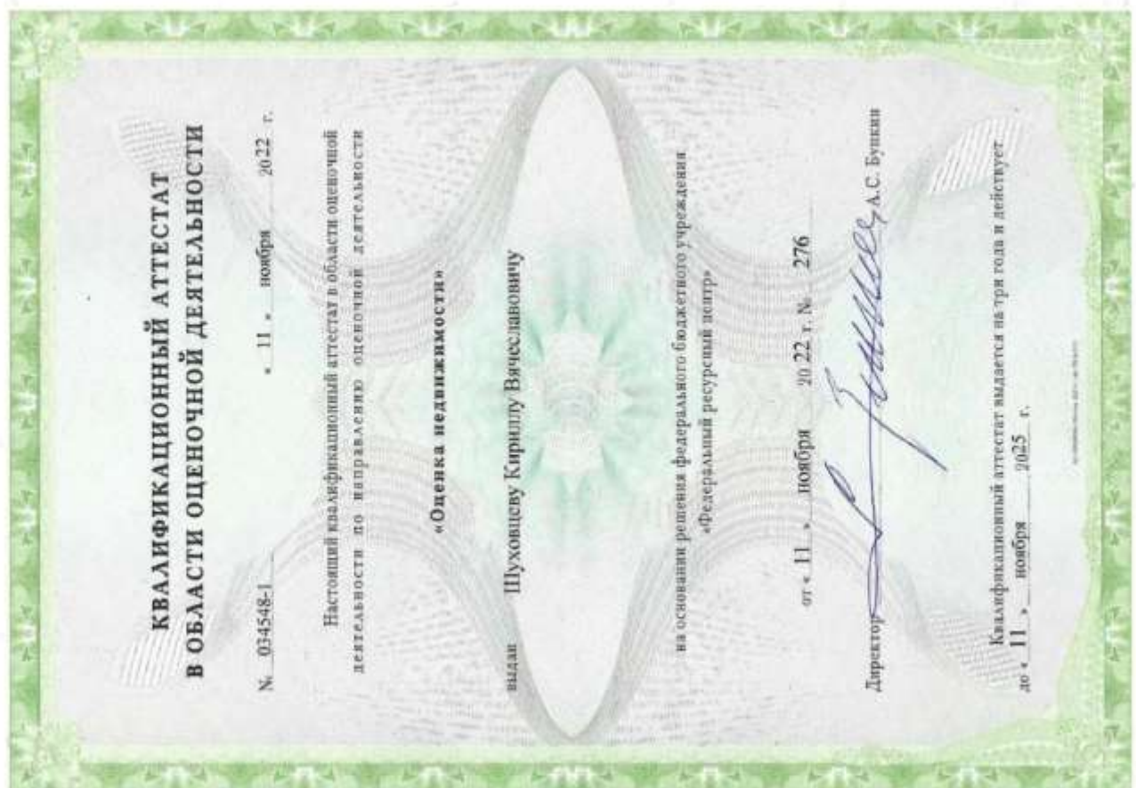
Квалификационный аттестат. Оценка недвижимости