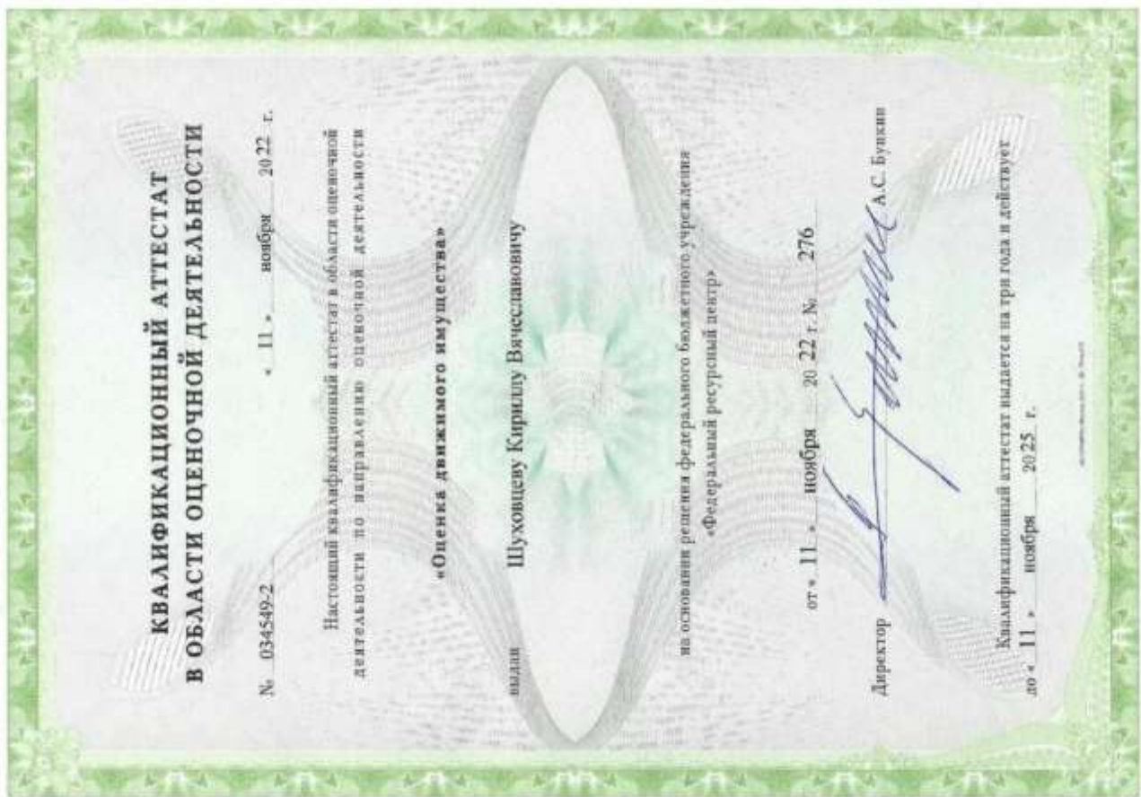
Квалификационный аттестат. Оценка движимого имущества