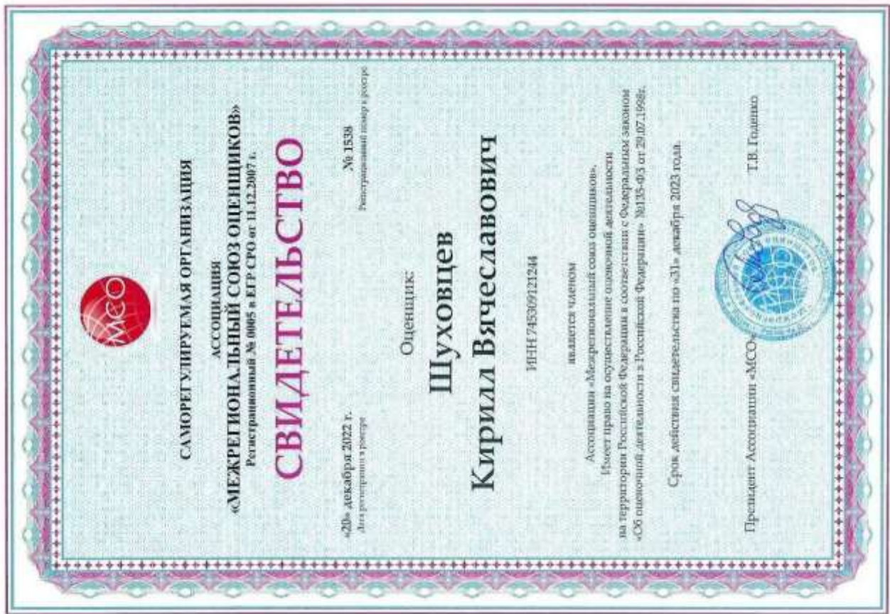
Свидетельство СРО оценщика