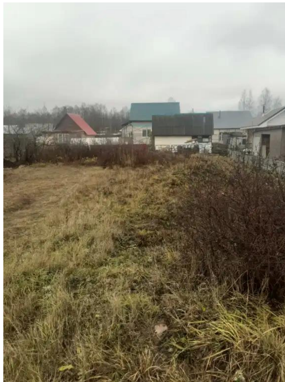
Фото №2. Общий вид участка