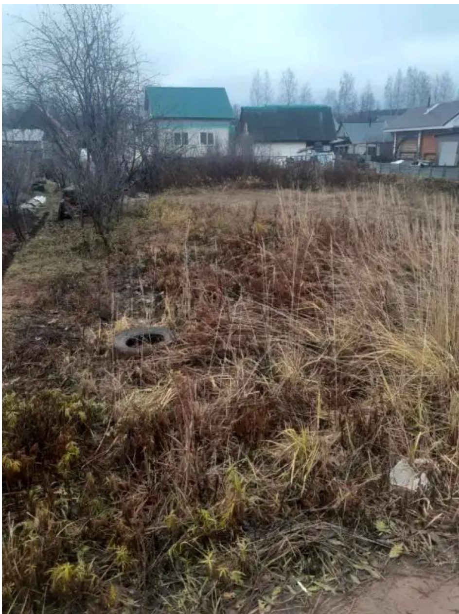
Фото №1. Общий вид участка