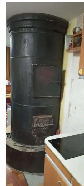
Фото №6. Общий вид дома