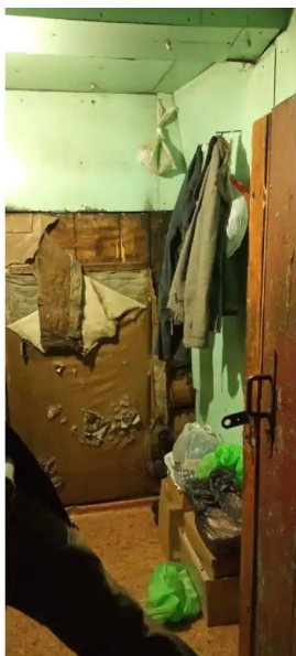
Фото №4. Общий вид дома