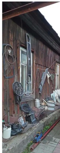
Фото №2. Общий вид дома