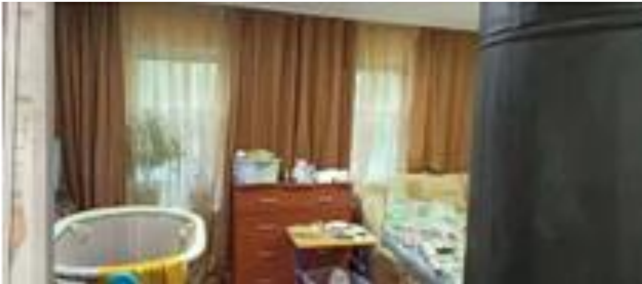
Фото №7. Общий вид дома