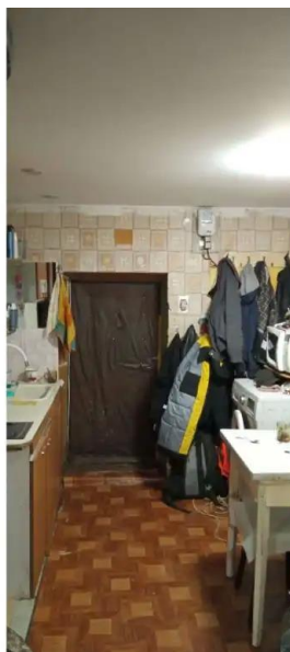
Фото №5. Общий вид дома