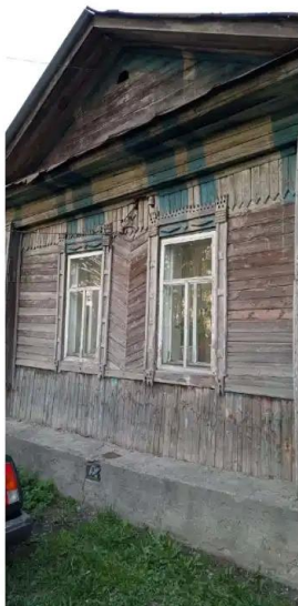
Фото №1. Общий вид дома