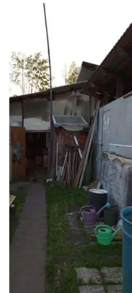
Фото №3. Общий вид дома