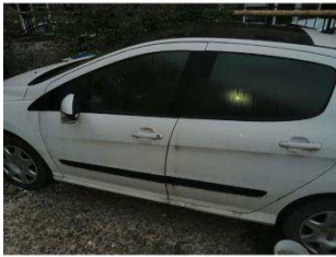
Общий вид ТС