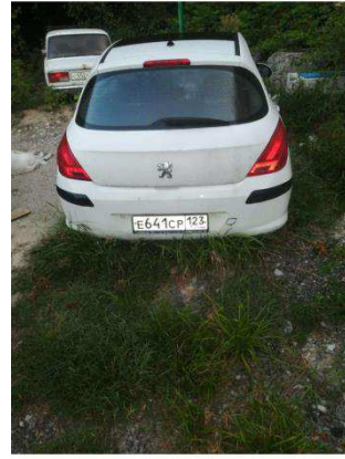
Общий вид ТС