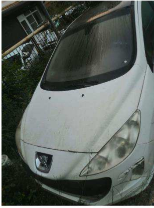
Общий вид ТС