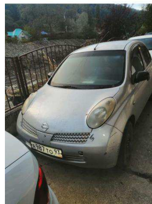
Общий вид ТС