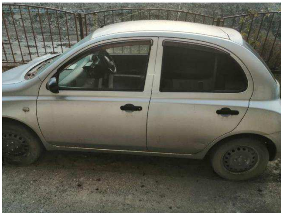
Общий вид ТС