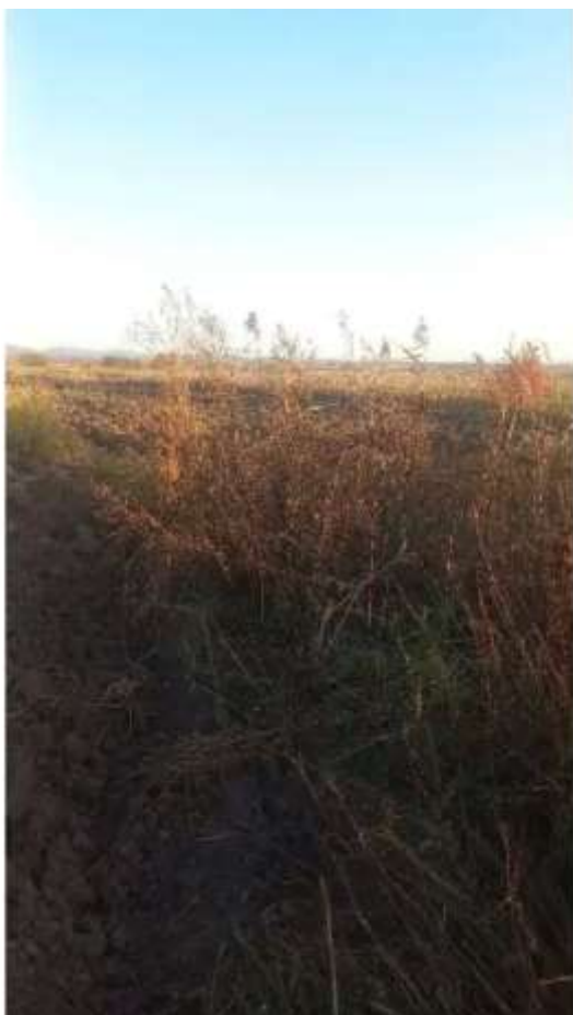
Фото №1. фото ЗУ

Выписка из отчета №2901242158. Фототаблица