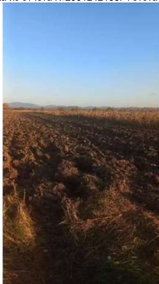
Фото №2. фото ЗУ