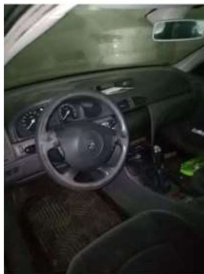
Фото №6. Общий вид