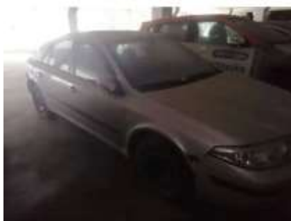
Фото №1. Общий вид