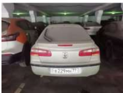
Фото №3. Общий вид