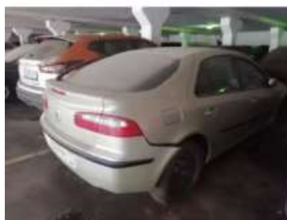
Фото №2. Общий вид