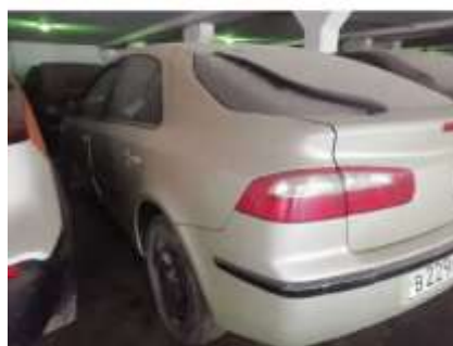
Фото №4. Общий вид