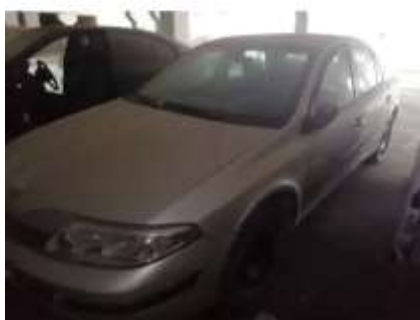
Фото №5. Общий вид