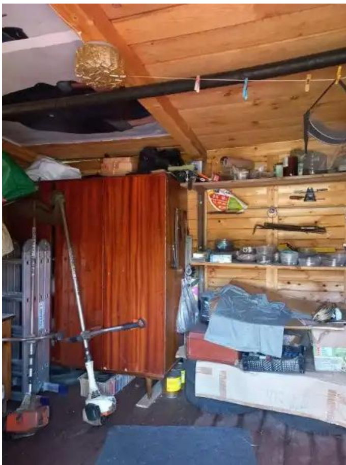
Фото №5. Общий вид дома