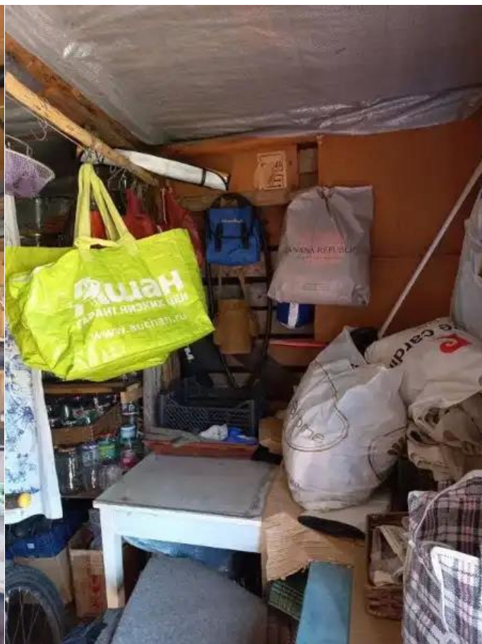
Фото №6. Общий вид дома