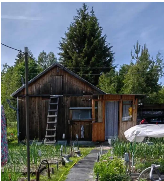
Фото №1. Общий вид дома на участке