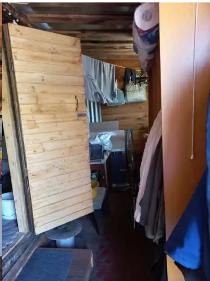
Фото №8. Общий вид дома