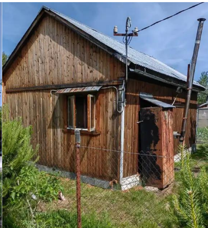
Фото №2. Общий вид дома на участке