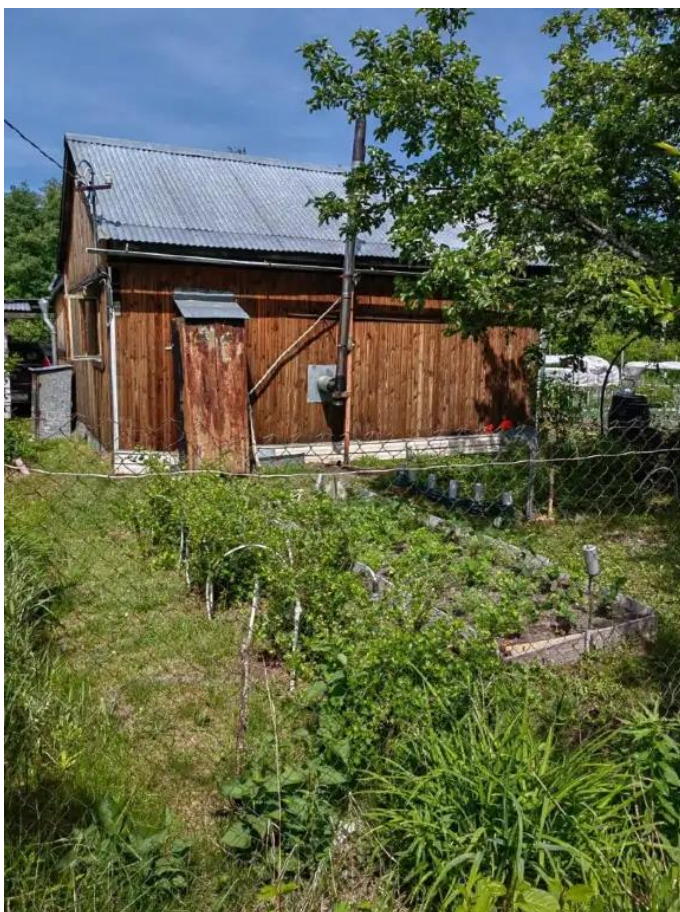
Фото №3. Общий вид дома на участке