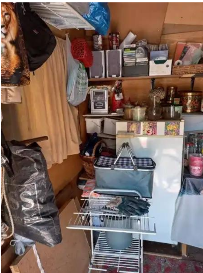
Фото №7. Общий вид дома