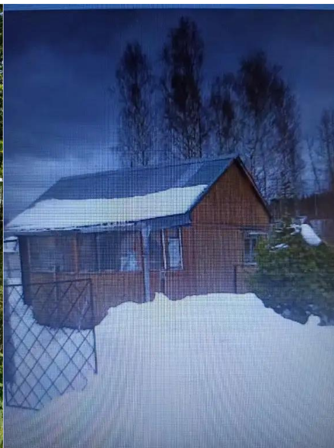
Фото №4. Общий вид дома на участке