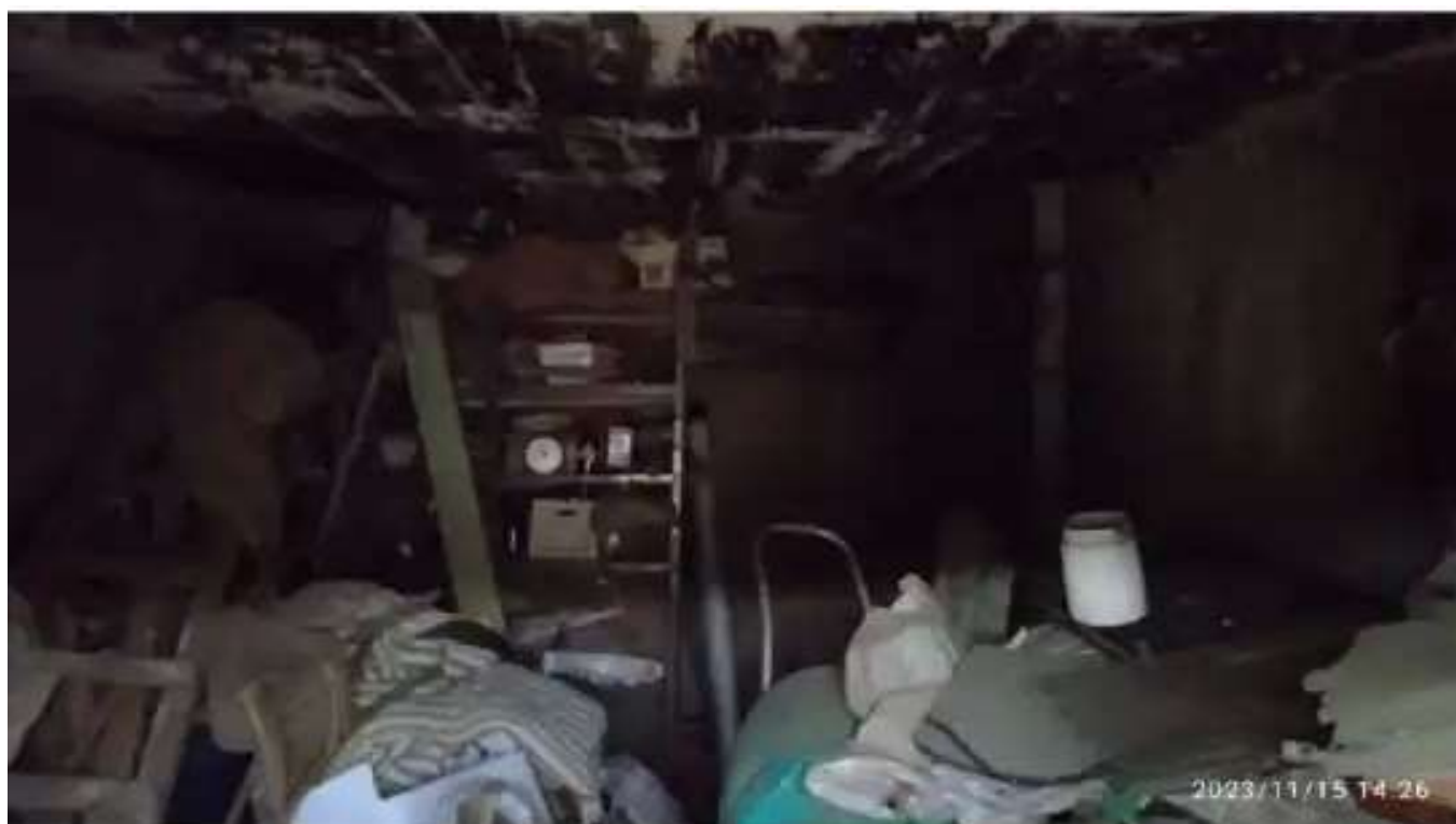
Фото №2. Общий вид гаража