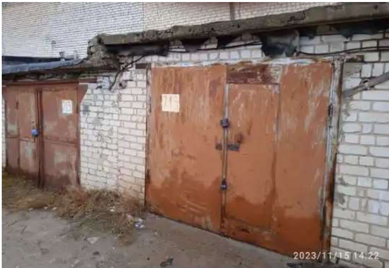
Фото №1. Общий вид гаража