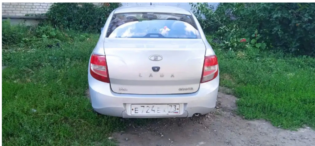
Фото №3. Фотографии автомобиля