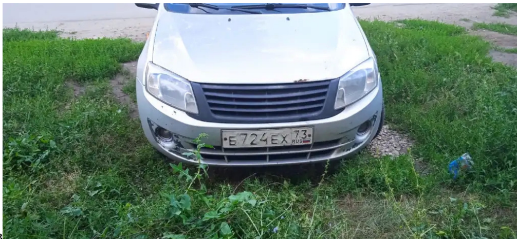
Фото №1. Фотографии автомобиля