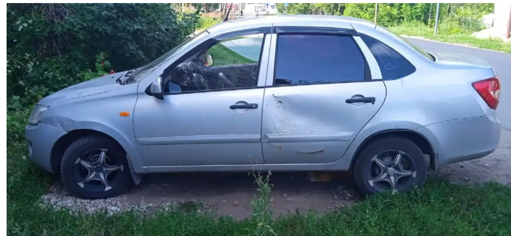
Фото №2. Фотографии автомобиля