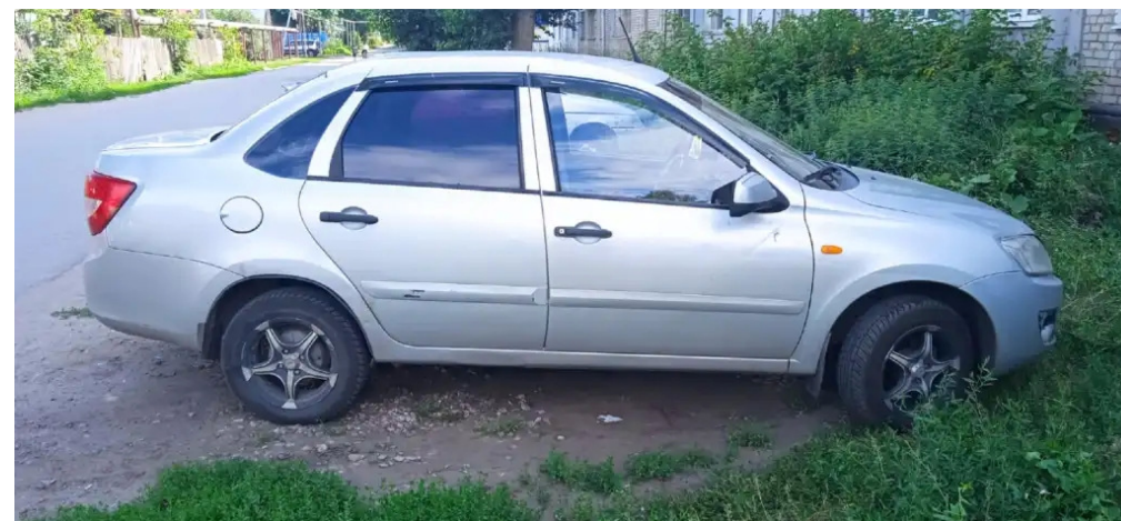
Фото №4. Фотографии автомобиля