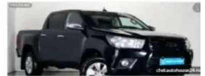
Toyota Hilux, VIII 2017. 1 602 000 ₽