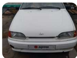
Лада 2114 Самара, 2012 250 000 ₽