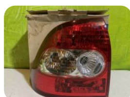
Фонарь левый Лада Приора Новый 21700371601100 2 100 ₽