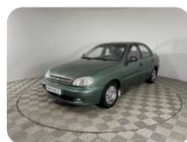
Chevrolet Lanos, 2007 209 000 ₽