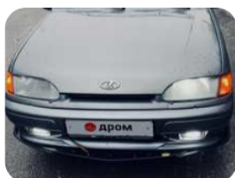
Лада 2114 Самара, 2006 210 000 ₽