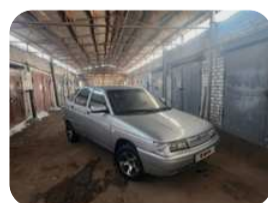
Лада 2112, 2005 250 000 ₽