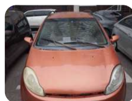
Chery Kimo A1, 2009 200 000 ₽