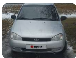
Лада Калина, 2007 220 000 ₽