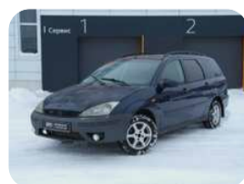
Ford Focus, 2004 250 000 ₽