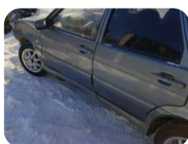
Лада 2114 Самара, 2010 205 000 ₽