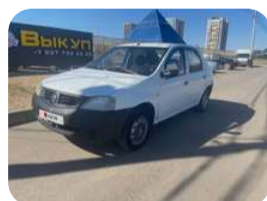
Renault Logan, 2007 220 000 ₽