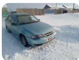
Daewoo Nexia, 2009 200 000 ₽