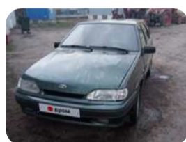
Лада 2114 Самара, 2008 240 000 ₽