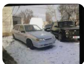
Лада 2114 Самара, 2011 210 000 ₽