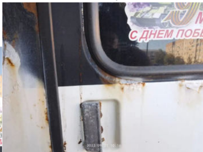
Фото №4. Изображение WhatsApp 2023-09-21 в 10