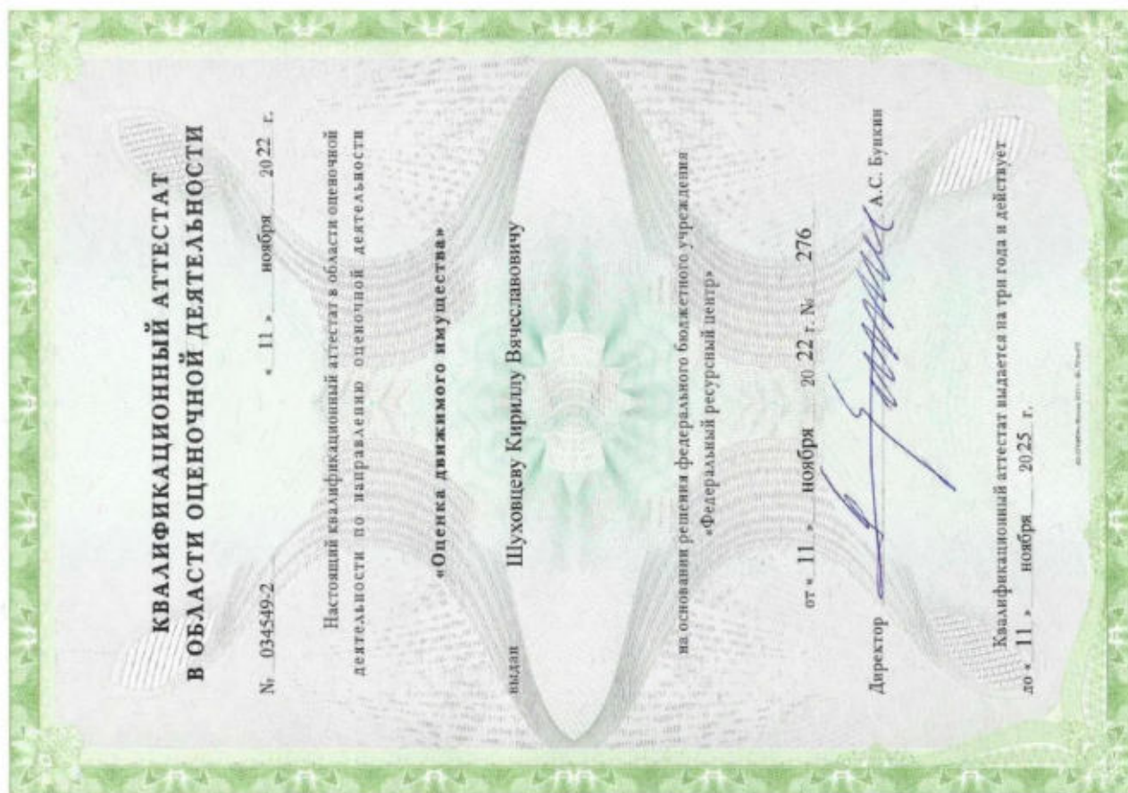
Квалификационный аттестат. Оценка движимого имущества