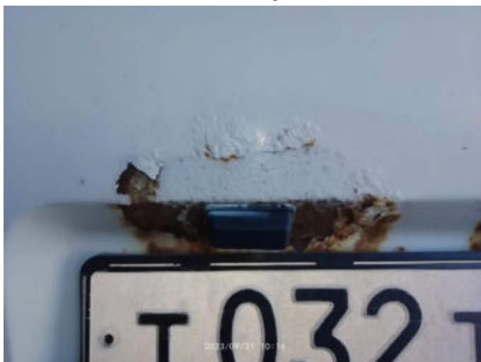
Фото №5. Изображение WhatsApp 2023-09-21 в 10