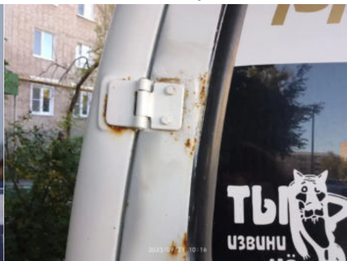
Фото №6. Изображение WhatsApp 2023-09-21 в 10