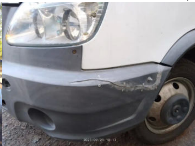
Фото №2. Изображение WhatsApp 2023-09-21 в 10