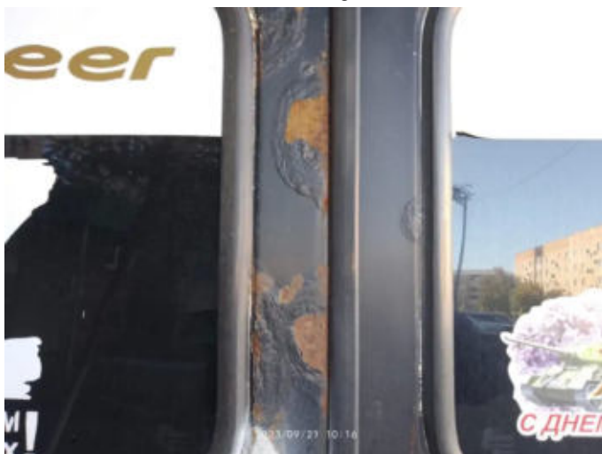
Фото №3. Изображение WhatsApp 2023-09-21 в 10