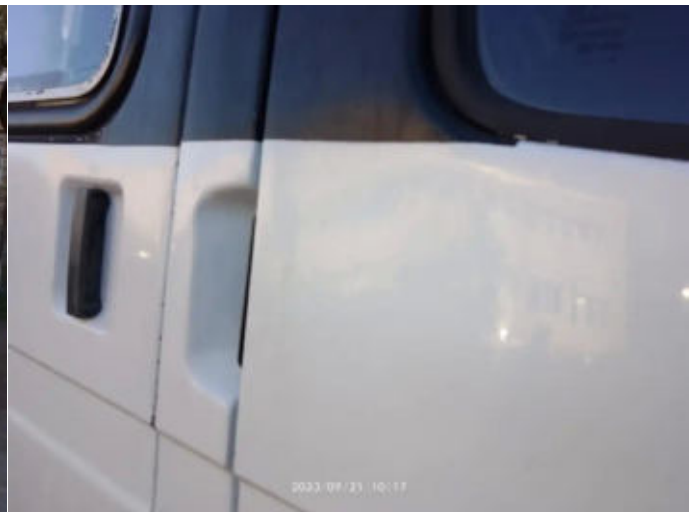
Фото №10. Изображение WhatsApp 2023-09-21 в 10