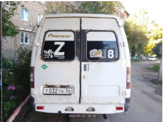
Фото №8. Изображение WhatsApp 2023-09-21 в 10