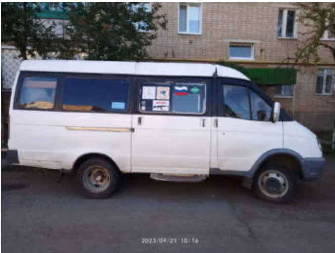
Фото №9. Изображение WhatsApp 2023-09-21 в 10