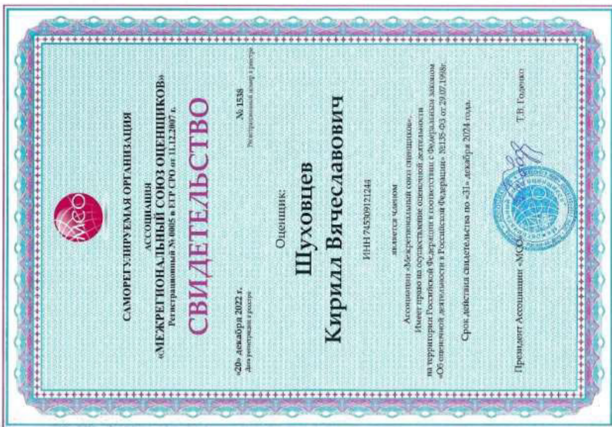
Свидетельство СПО оценщика