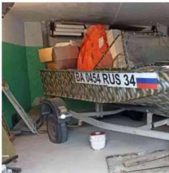
Фото №1. Общий вид